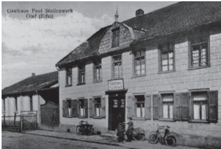
Gasthaus Stollenwerk um 1920