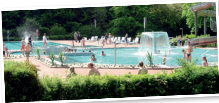
Erlebnisfreibad Dieffenbach Schleiden

Erlebnisfreibad Dieffenbach Schleiden & Rosenbad Gemünd