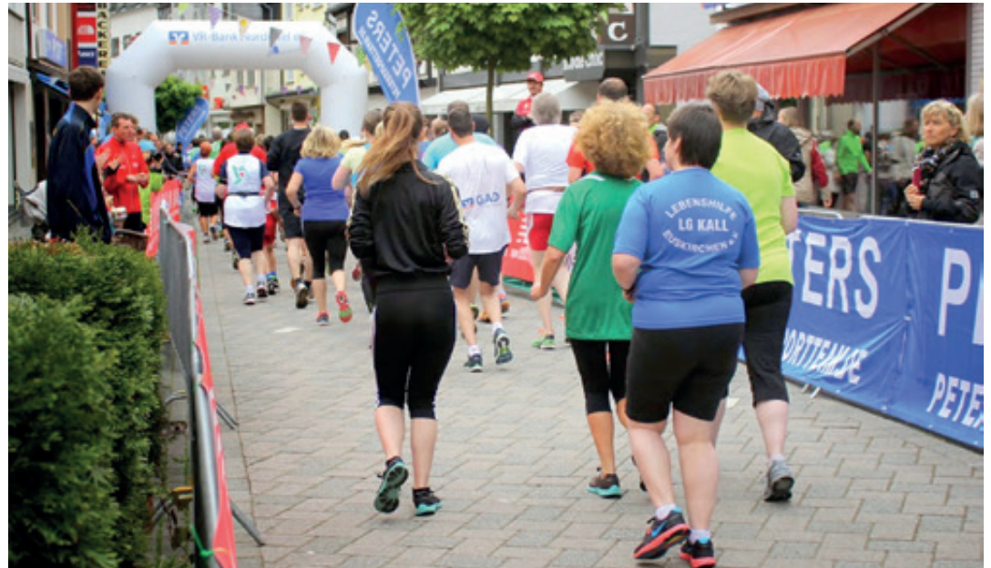
Dicht gedrängte Läufer Schlange in der Dreiborner Straße

Auch Firmen können sich wieder sportlich präsentieren: „Die Firmwertung im 5000 Meterlauf