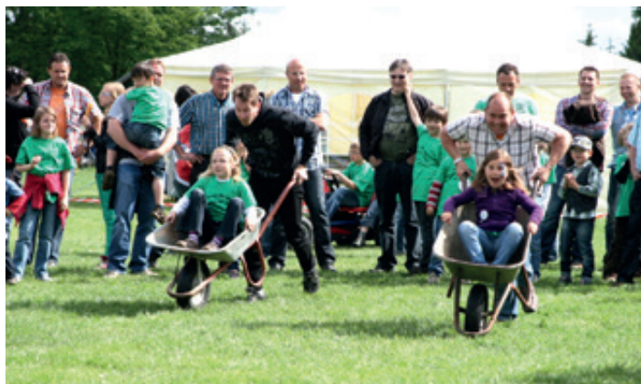
Schubkarrenrennen der Eltern und Kinder

Dort erwartet die Besucher ein buntes Programm. Es gibt viele Möglichkeiten beim Basteln und Spielen aktiv zu sein. Die örtlichen Musikgruppen einschließlich der Drums & Pipes gestalten den musikalischen Rahmen. Neben