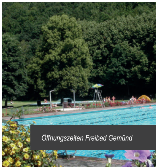
Öffnungszeiten Freibad Gemünd