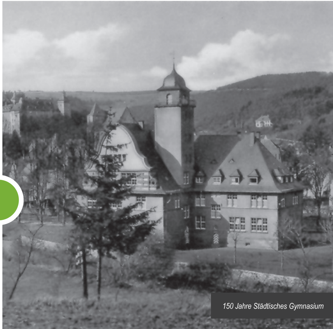
150 Jahre Städtisches Gymnasium