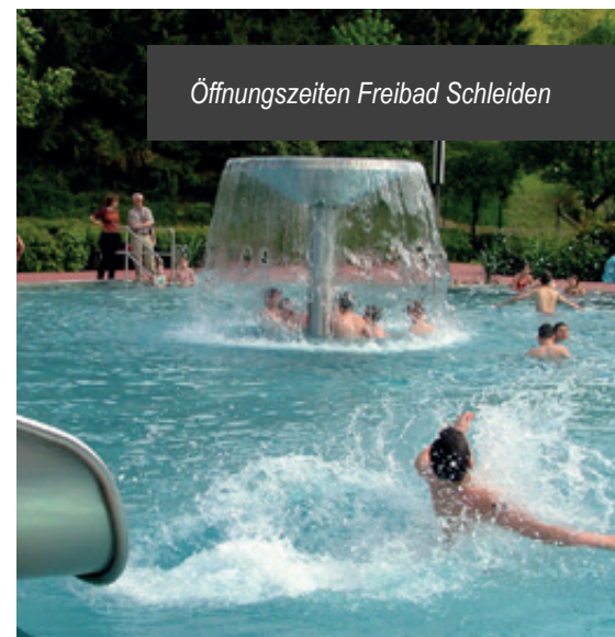
Öffnungszeiten Freibad Schleiden