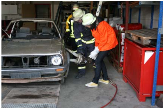
Girls´Day 2008 bei der Feuerwehr; mit der Hydraulikschere wurde von einer Teilnehmerin das Unfallauto geöffnet.

Die Stadtverwaltung Bad Münstereifel hat sich bereits im letzten Jahr mit Angeboten beteiligt. In diesem Jahr wird interessierten Mädchen wiederum ermöglicht, die Tätigkeit in der Feuerwehr und dem Rettungsdienst kennen zu lernen. Erneut beteiligen sich auch die Stadtwerke mit ihren technischen Berufszweigen.