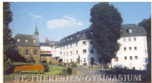
Sankt-Theresien-Gymnasium in Schönenberg