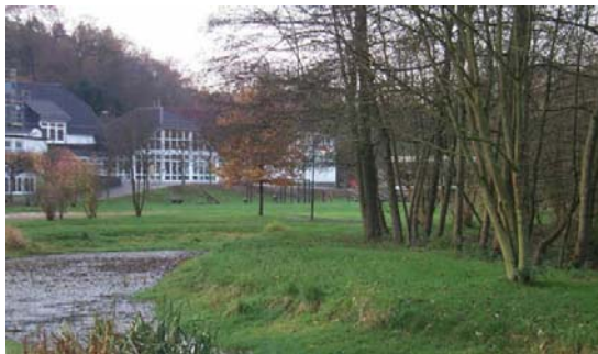
Grundschrift Schönenberg am Brölbach