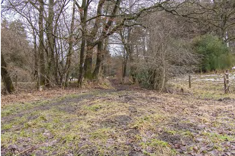
Heute noch als Fußweg benutzter ehemalige Fahrweg zum Knapp, 2015 Alte Roetgener Zugangsstraßen (Kartenpos. 2)

3m hoch. Heute sind diese Überbleibsel manchmal mit Wasser gefüllt und Bäume wachsen in der ehemaligen Fahrspur.