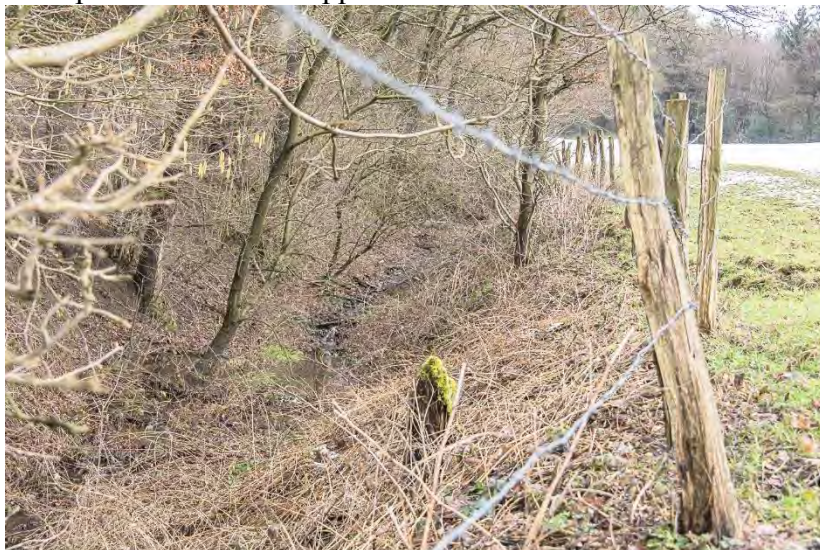
Alter Hohlweg parallel zum Kuhberg, ca. 100m südlich, 2015 Alte Roetgener Zugangsstraßen (Kartenpos. 2)