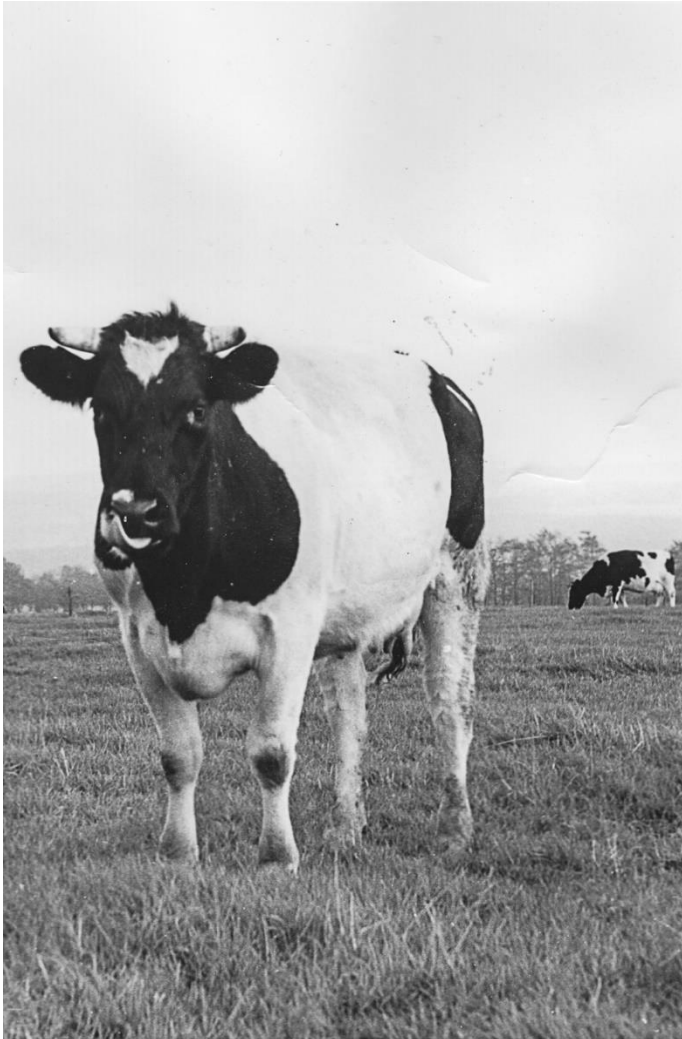
Die „Roetgener Kuh“, heute (2015) gilt sie als „ausgestorben“. Roetgener Landwirtschaft