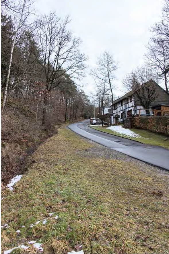
Der Kuhberg mit seinem steilen Anstieg, 2015 Alte Roetgener Zugangsstraßen (Kartenpos. 1) HeuGeVe: 102/1-1

Der Kuhberg ist heute (2015) nur noch für Anliegerverkehr zugelassen. Wenn man diese steile Straße hinaufgeht, kann man kaum glauben, dass hier einmal Pferdefuhrwerke mit Waren entlang gerollt sind. Doch dies war vor mehr als 200 Jahren eine Roetgener Ausfallstraße für Frachtverkehr, die sicher stark befahren war. In seinem Aufsatz „Knapp“ beschreibt Cosler im Lexikon die gleichnamige Flur als wahrscheinlich eine der ältesten Siedlungsgebiete in Roetgen. 7 In einer heute verlorenen Druckschrift wurde beschrieben, wie vor allem Köhler diesen Teil von Roetgen einst besiedelten. Deren Überreste findet man heute noch in Form von