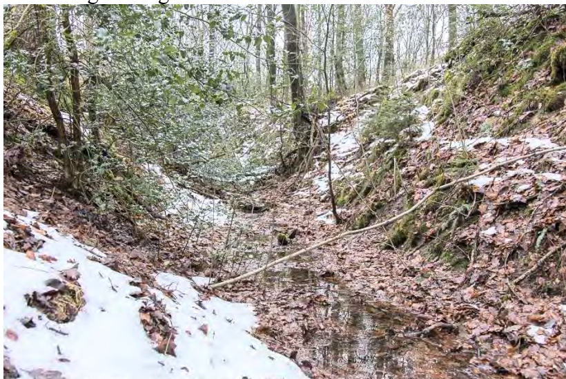
Der Hohlweg, der im 18. und 19. Jahrhundert eine Fernstraße nach Vossenack war, 2015 Alte Roetgener Zugangsstraßen (Kartenpos. 4)

Es war also klug, möglichst nicht zu viele Wertsachen bei sich zu tragen, wenn man unterwegs war. Andererseits brauchen Geschäftsreisende gelegentlich Geld, um z.B. Waren bezahlen zu können. Da damals auch Sparkassen oder Banken am Wegesrand fehlten, wurde die „Waldbank“ erfunden: Manche Geschäftsleute hatten Geldverstecke an ihren Reiserouten; das waren z.B. hohle Bäume, Höhlen oder dergleichen. So etwas wurde natürlich geheim gehalten.