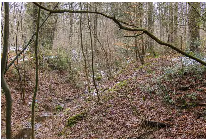
Weiterführender Hohlweg von Roetgen nach Vossenack und Germeter, 2015 Alte Roetgener Zugangsstraßen (Kartenpos. 3)

Bei der Unterförsterei Jägerhaus stößt er auf die vor mehreren Jahren angelegte Chaussee von Lammersdorf nach Germeter. 11 Die eigentliche alte Straße nach Germeter und dem Jülicher Land, ein zum Teil tiefer Hohlweg, ist gegenwärtig an den meisten Stellen gänzlich zugewachsen, verfallen und unbrauchbar.