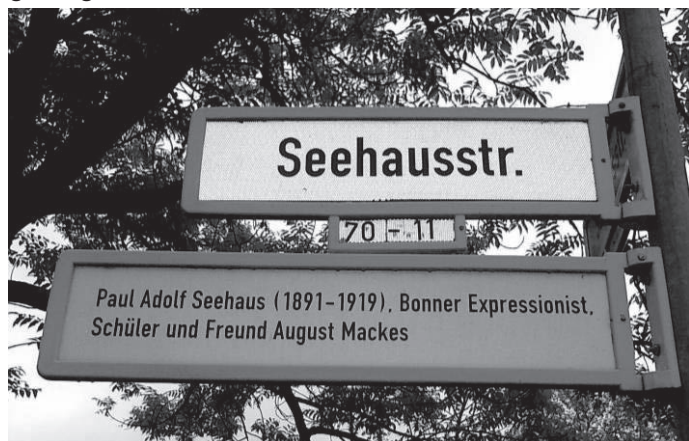
Die Seehausstraße in Auerberg