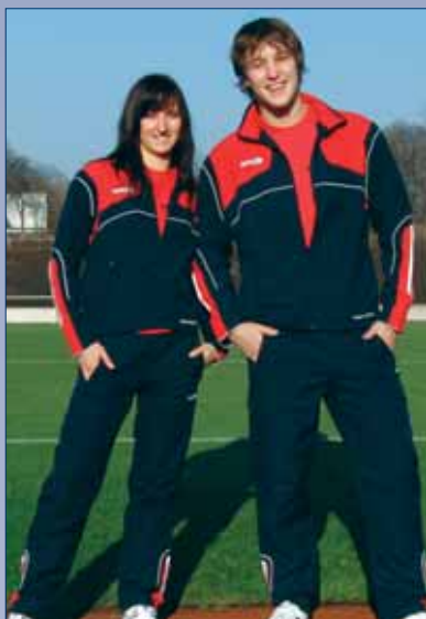
Trainingsanzüge, Poloshirts und vieles mehr.....