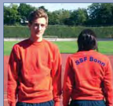
Einkauf und Bestellung in der SSF-Geschäftsstelle, Kölnstraße 313 a, 53117 Bonn