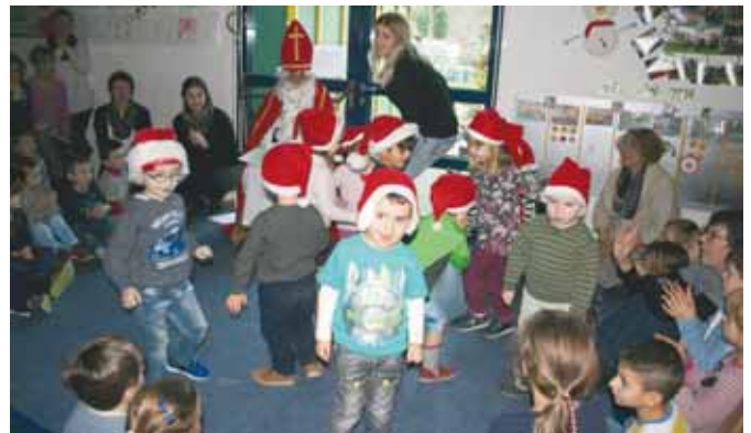
Die Kinder der Rasselbande führten zu Ehren des heiligen Nikolaus einen Tanz vor.