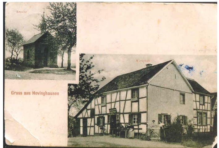
Postkarte „Gruss aus Hevinghausen“ aus den 20er Jahren