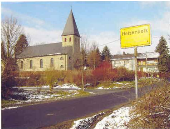
Ortseingang Hetzenholz aus südlicher Richtung

In Hetzenholz leben heute insgesamt 122 Einwohner. Der Ort liegt idyllisch, umrahmt von Wäldern und Wiesen. Wer den Ort anfährt, egal aus welcher Richtung, ob aus nord-westlicher, östlicher oder südlicher Richtung, bekommt den Eindruck, durch den Wald zu fahren. Aus südlicher Richtung kommend erblickt man als erstes die Ferialkirche St. Josef Hetzenholz am Ortseingang. Hetzenholz selber besteht nur aus 42 Häusern und ist somit nicht sehr groß.