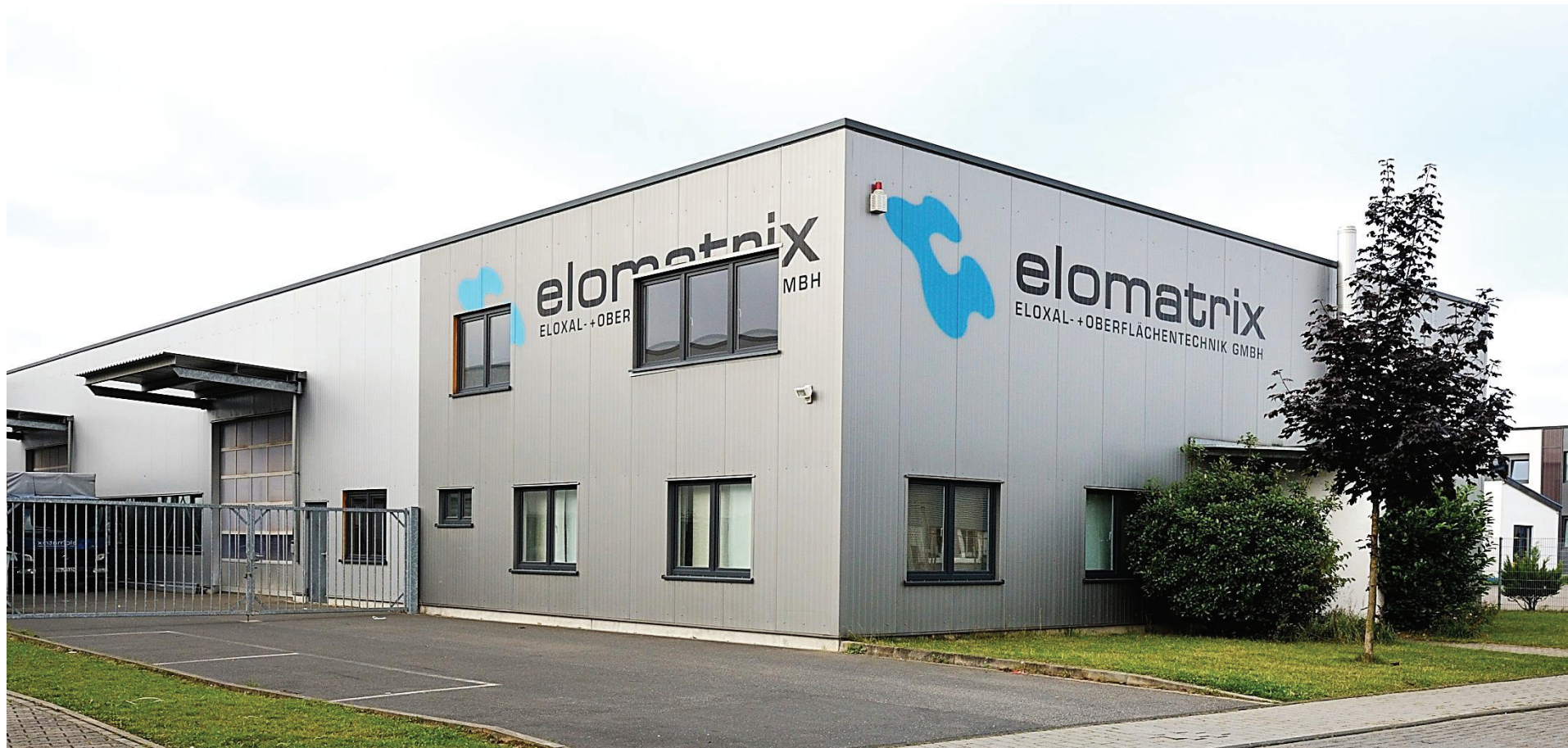
Junkersring 17, elomatrix - Eloxal-und Oberflächentechnik GmbH