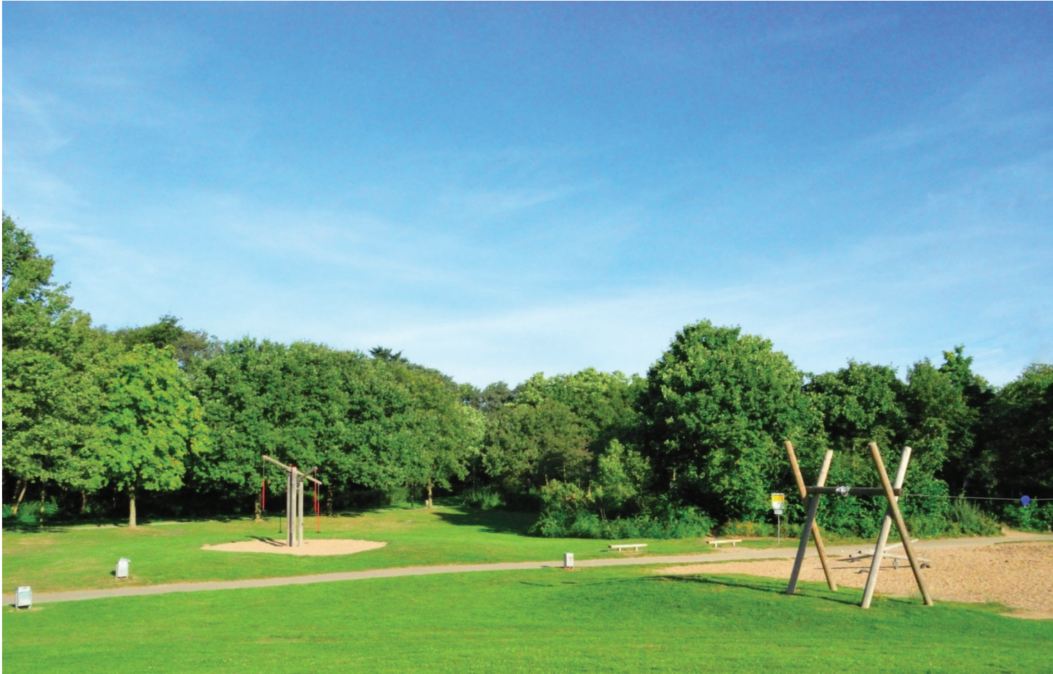
Familienpark und Kinderspielplatz