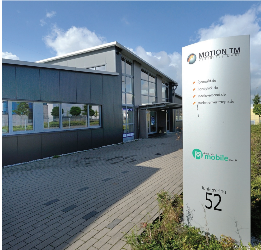
Junkersring 52, MOTION TM Vertriebs GmbH