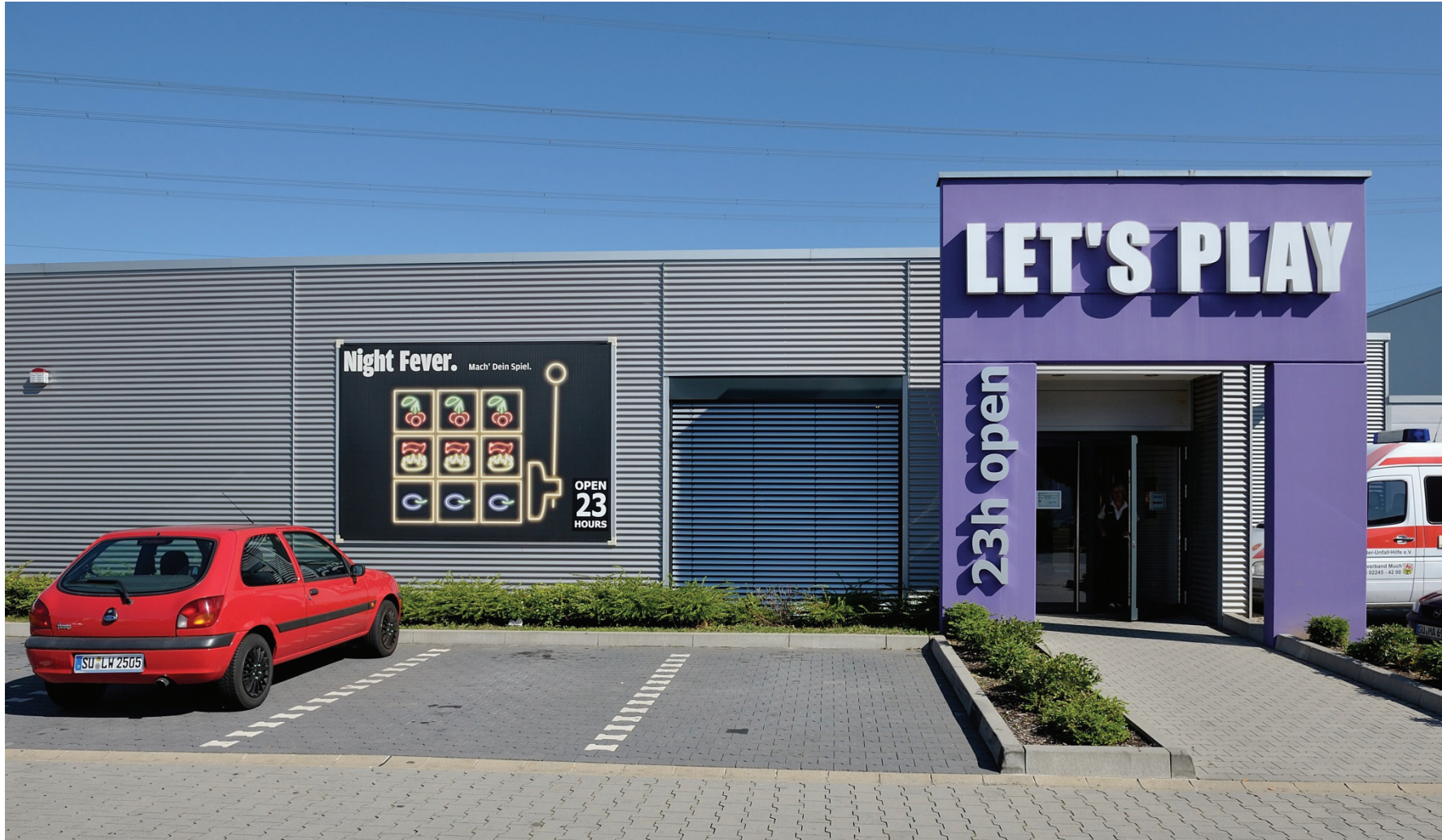
Junkersring 14, Jota Freizeitbetriebe GmbH, Spielcasino