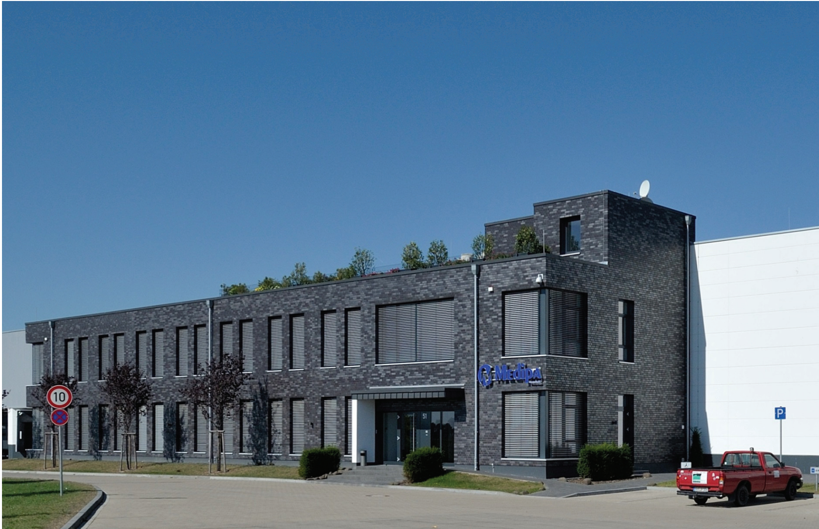
Junkersring 51, Medipa Group GmbH