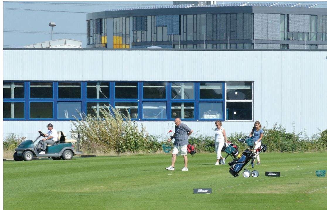
Golfsport unmittelbar am Gewerbepark