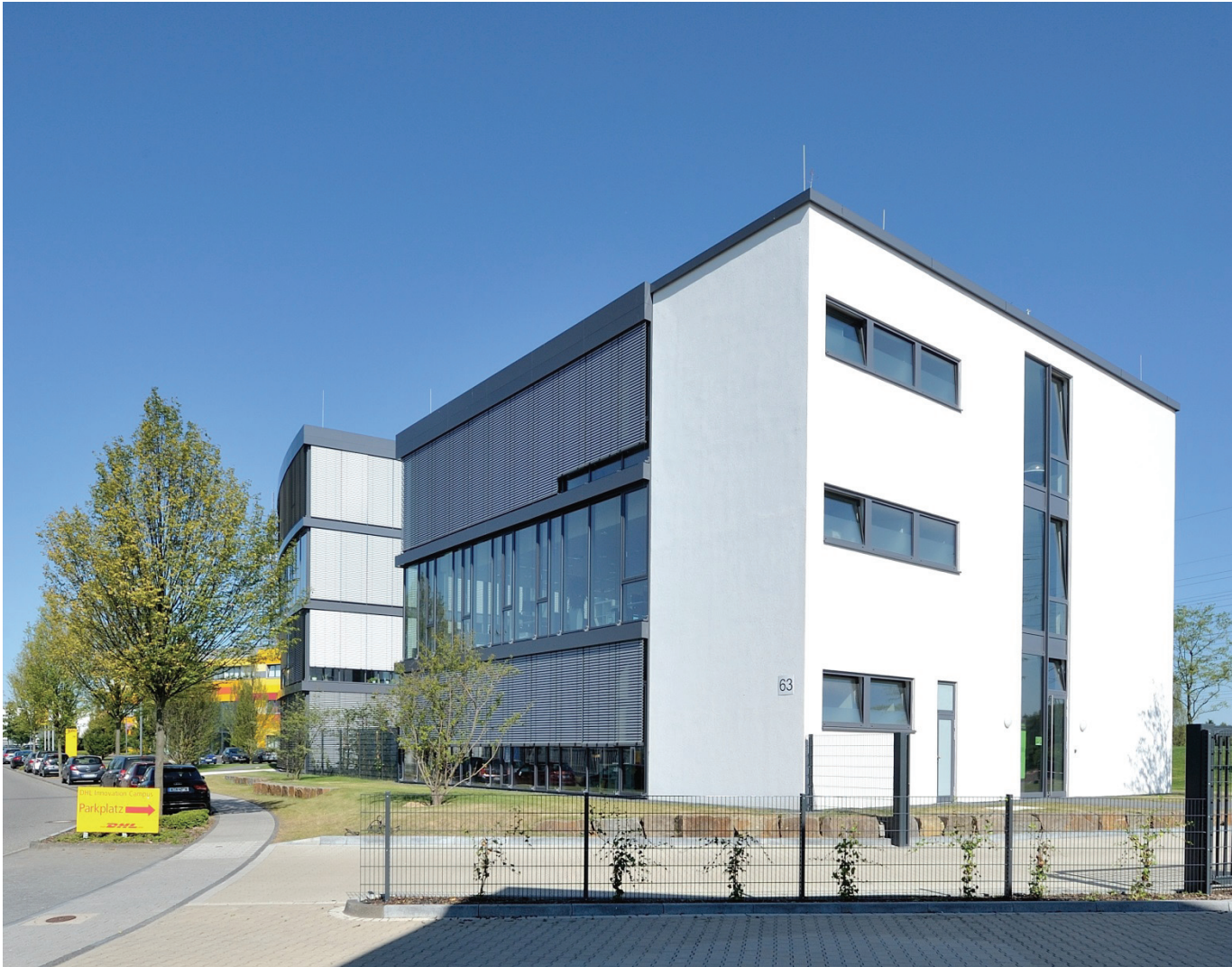
Junkersring 63, DHL-Gebäude „Cube“. Das Gebäude wird von der Agheera GmbH genutzt.