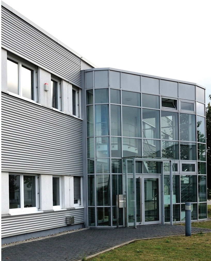
Junkersring 20, RSP Direktmarketing GmbH