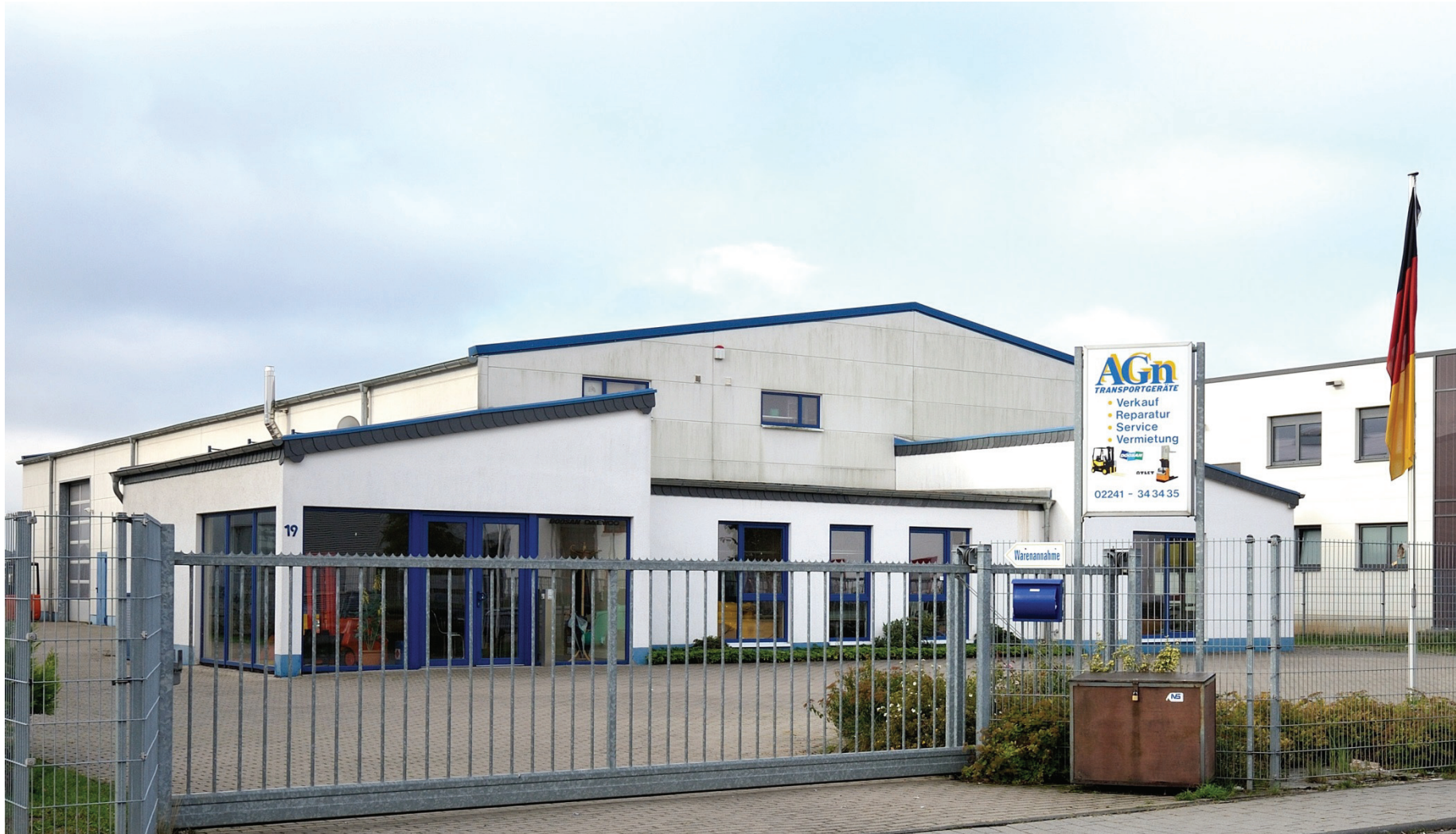
Junkersring 19, AGn Transportgeräte GmbH