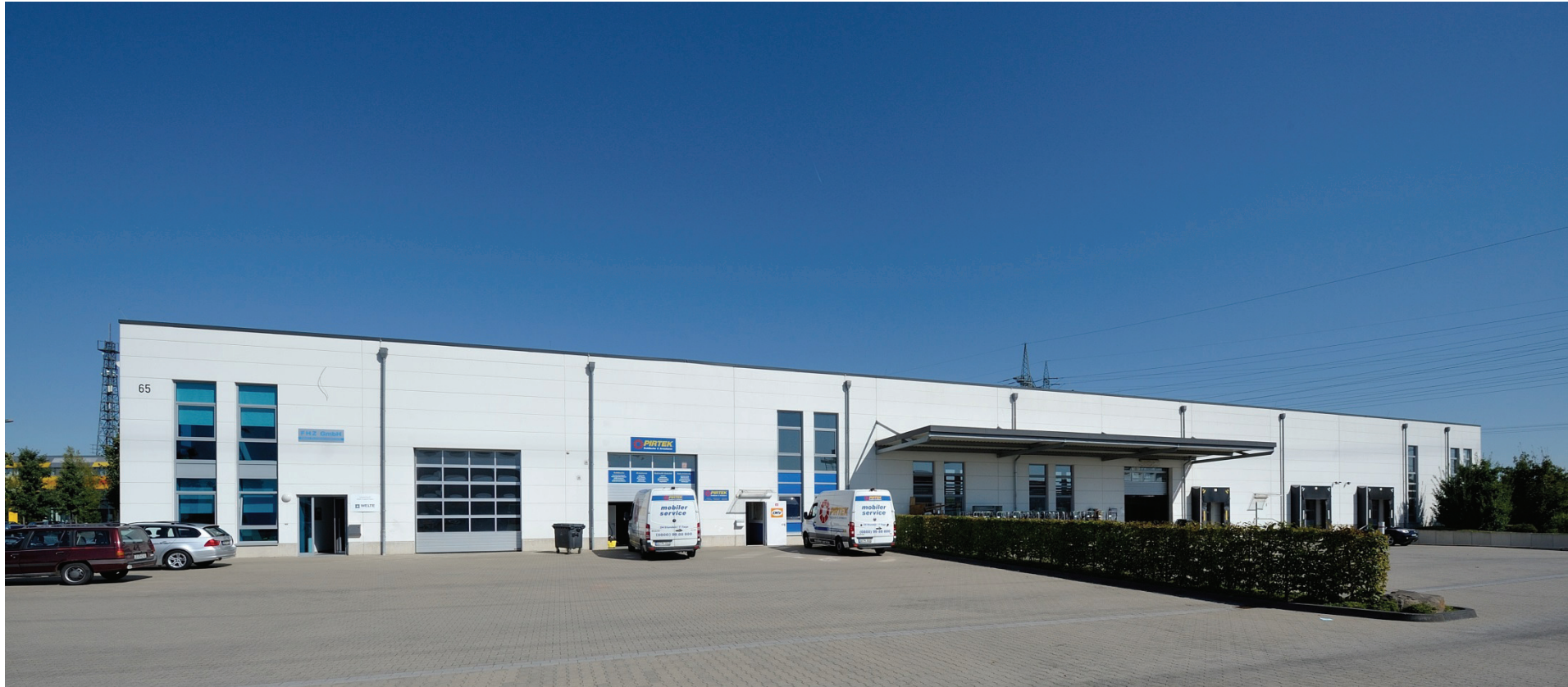
Junkersring 65, Fabia & Heistrüvers Zerkleinerungstechnik GmbH&Co KG; Welte Mahltechnik; PIRTEK