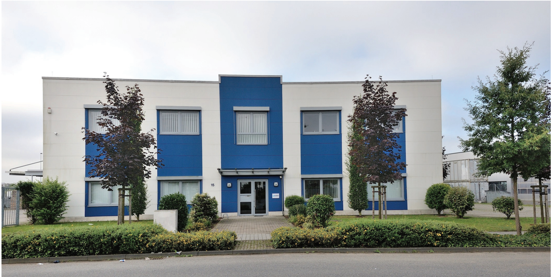
Junkersring 15, Huber GmbH