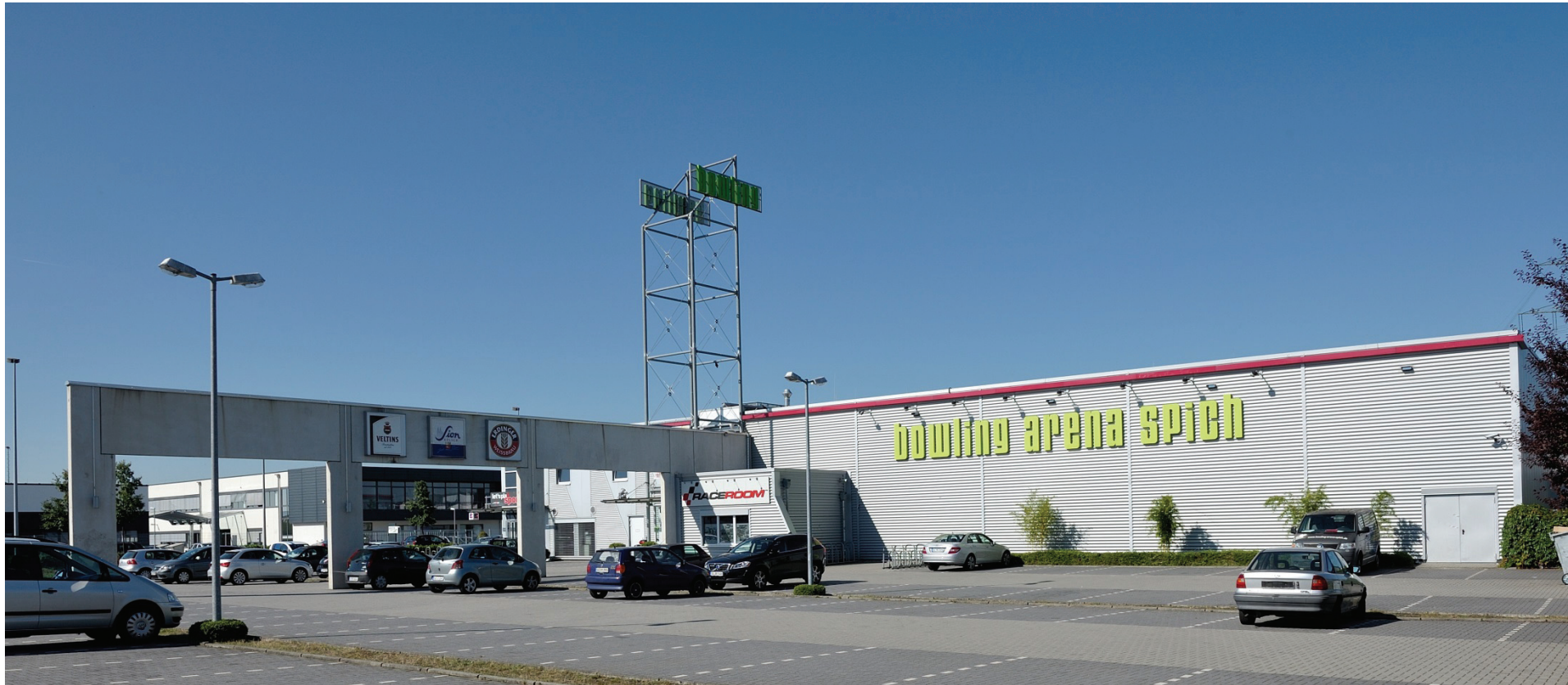
Heinkelstraße 1, Bowling Arena Spich