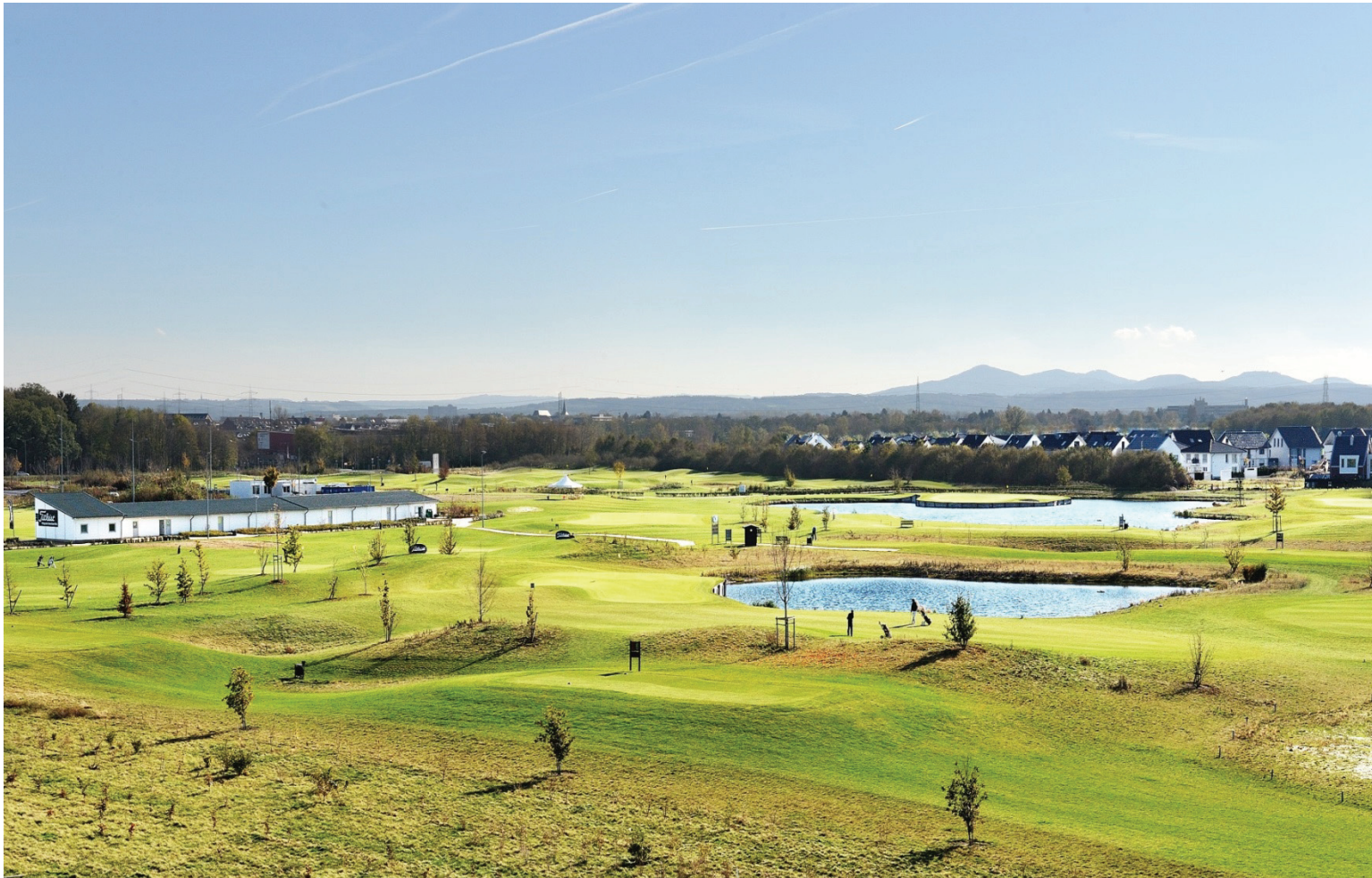
Golfplatz der West Golf GmbH, im Hintergrund der Stadtteil Kriegsdorf und das Siebengebirge