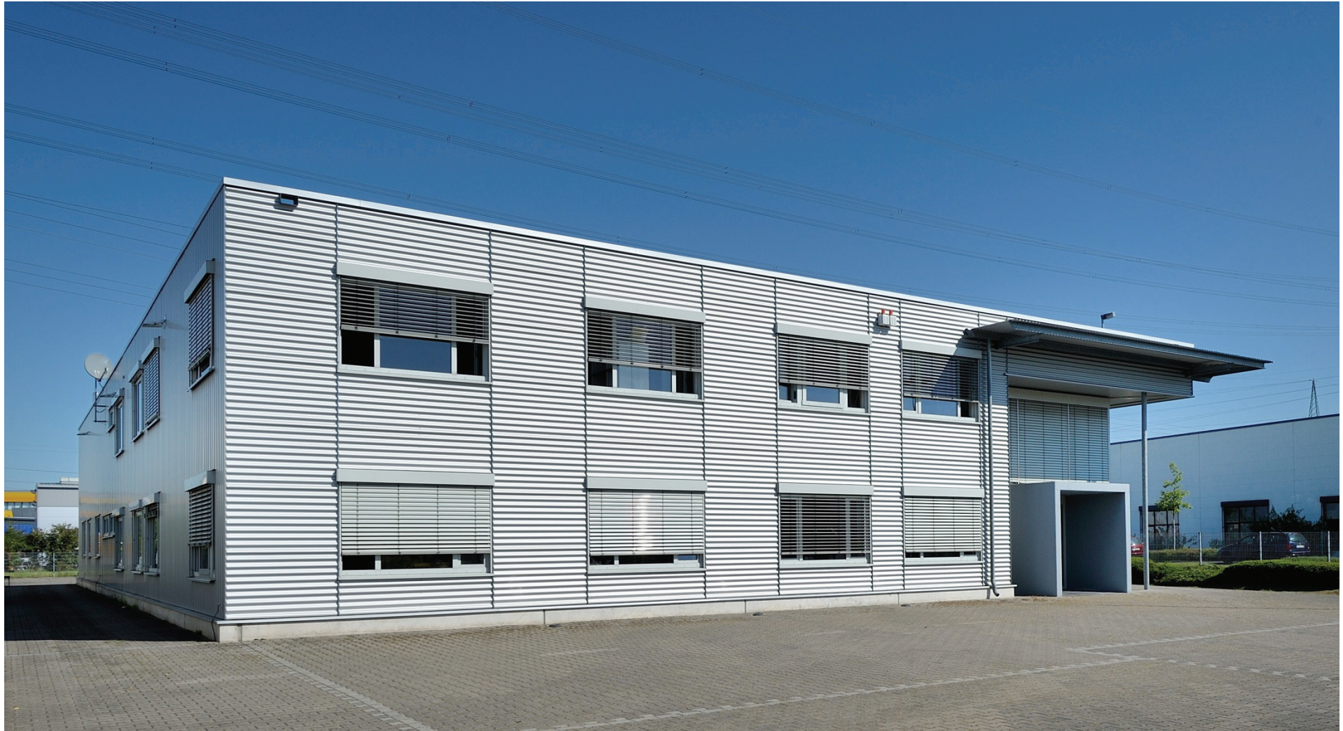
Junkersring 18, Wollschläger GmbH & Co. KG, Bild 2