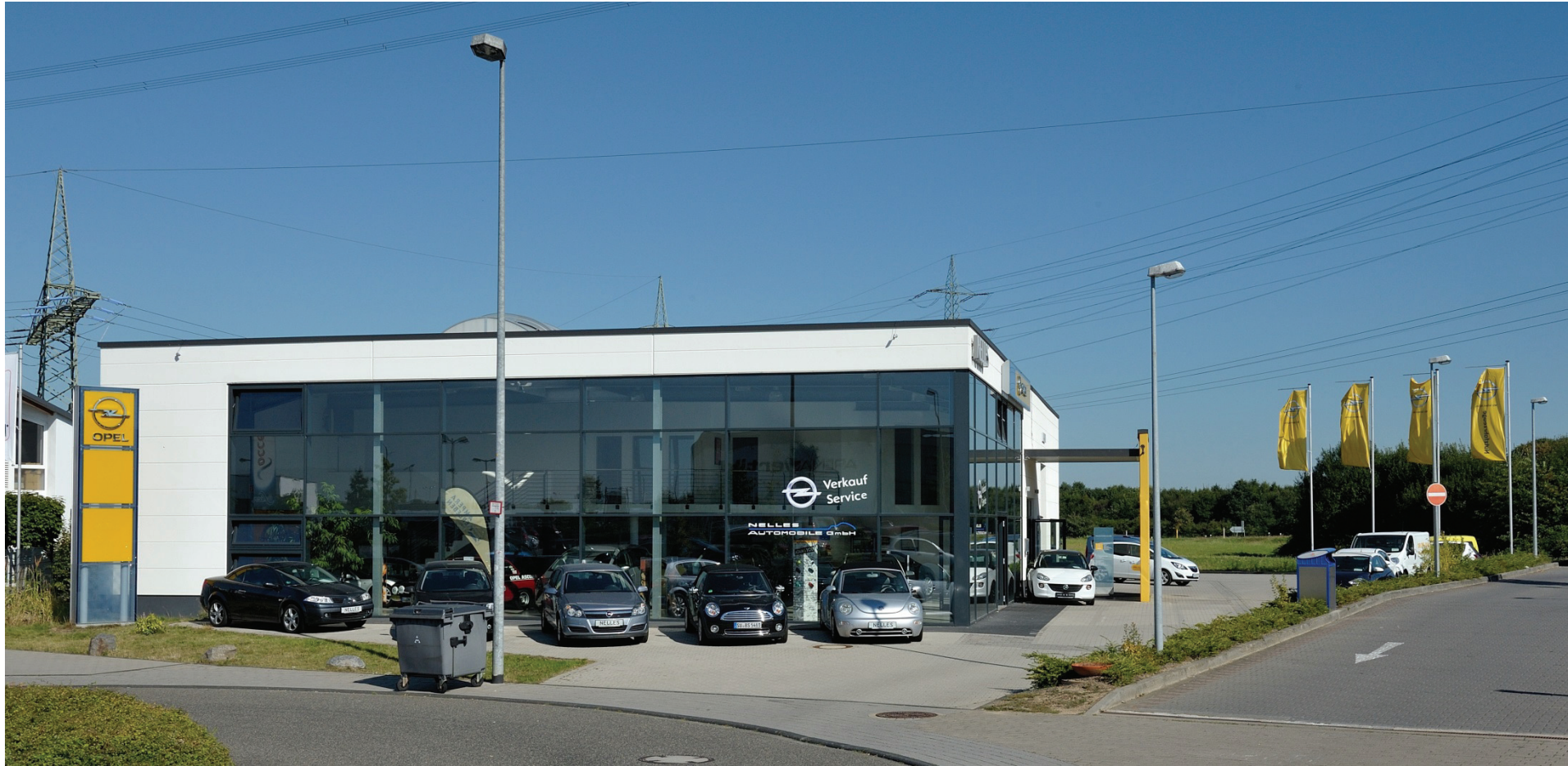
Heinkelstraße 5, Nelles Automobile GmbH