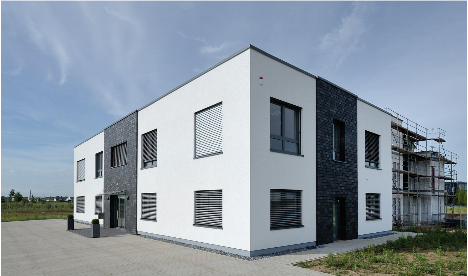
Junkersring 23, MicroControl-GmbH & Co. KG (daneben rechts der Neubau eines Bürogebäudes auf Junkersring 25)