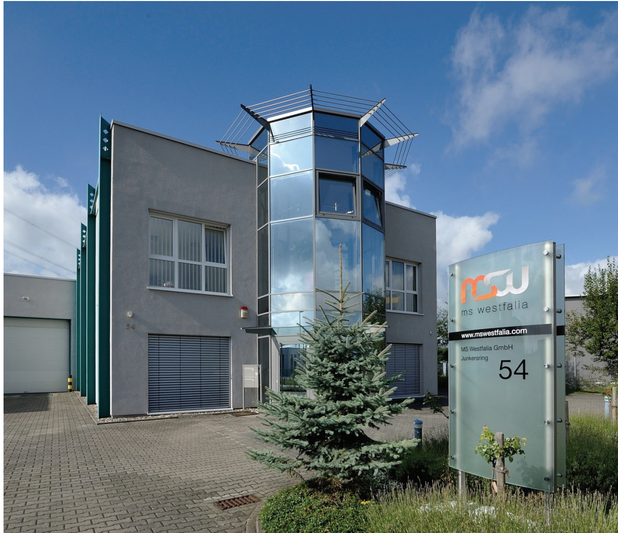
Junkersring 54, MS westfalia GmbH