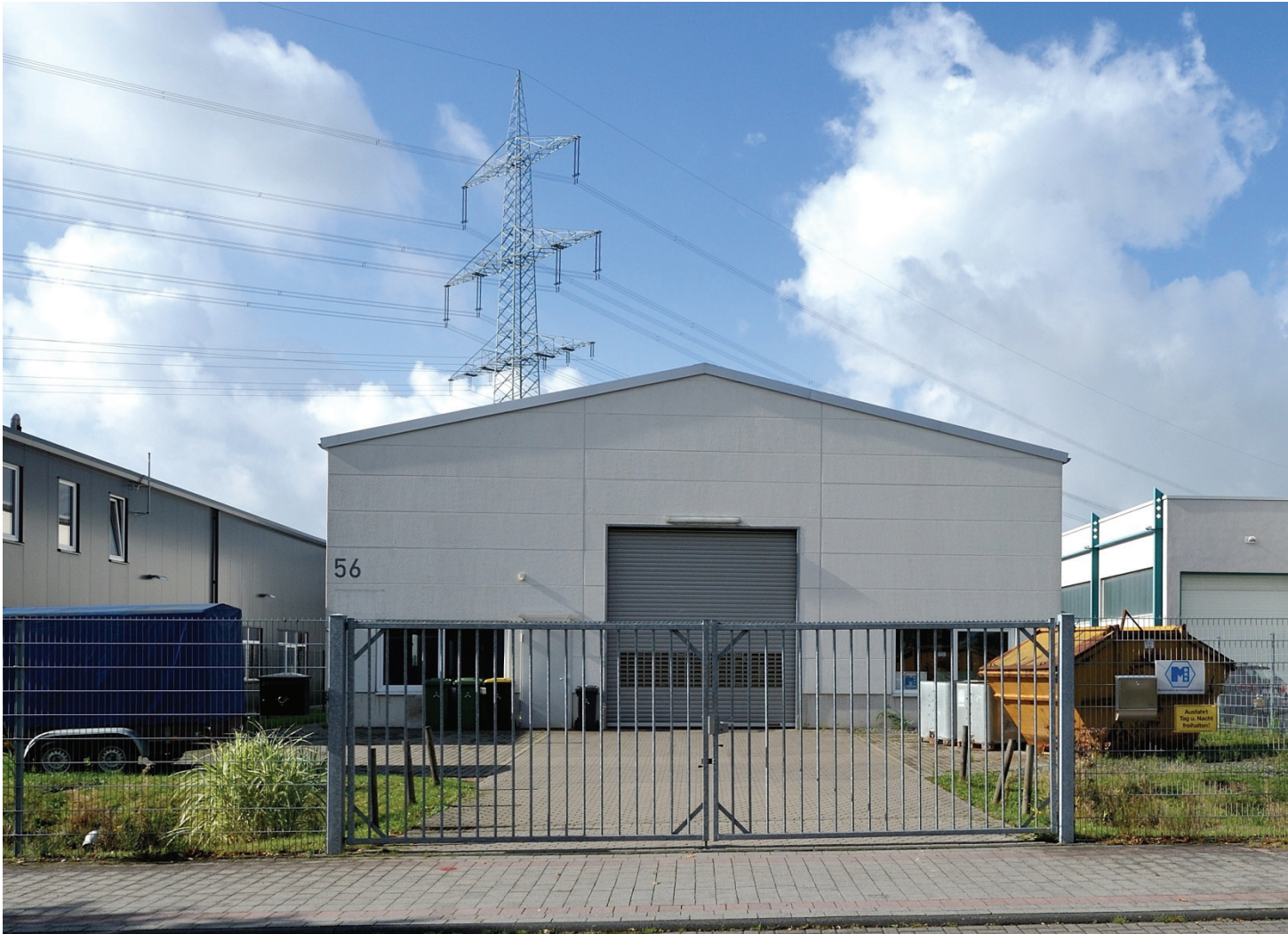
Junkersring 56, M BRO Maschinenbau