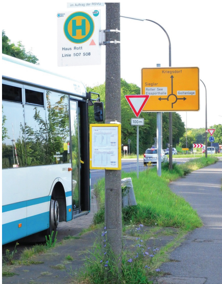
Öffentlicher Nahverkehr, Haltestelle Junkersring/Haus Rott