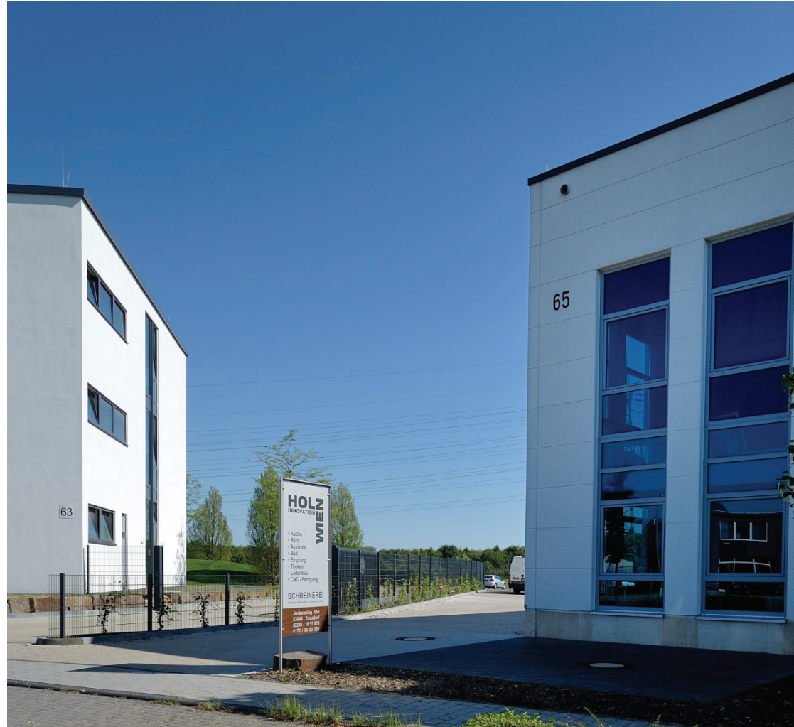
Junkersring 65 a, Wien-Holz Innovation, im Gebäude 65