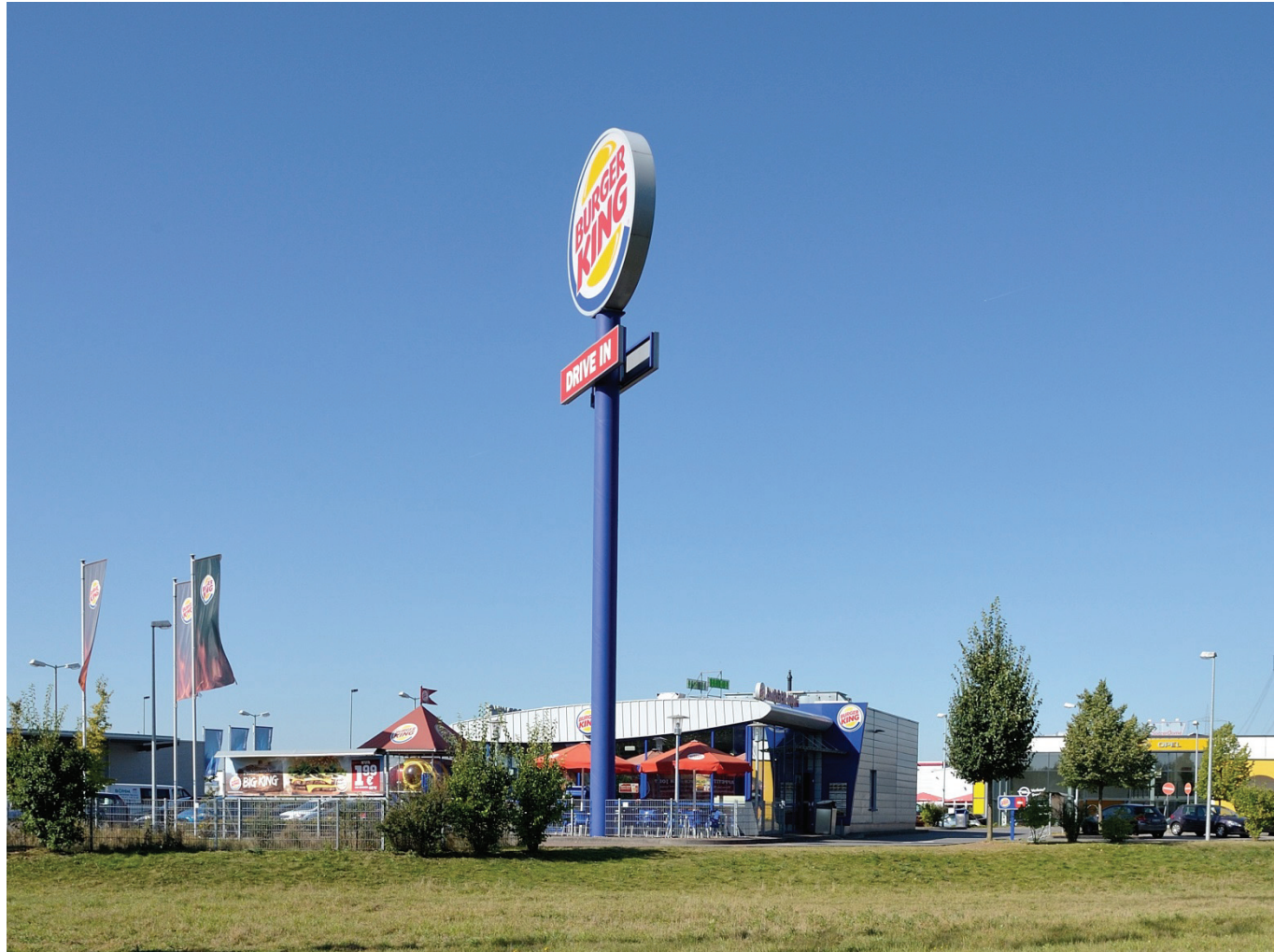
Heinkelstraße 6, Burger King Beteiligungs GmbH