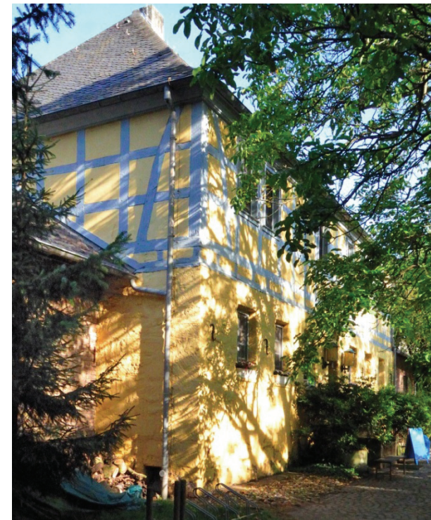
Haus Rott, ehemaliges Rittergut