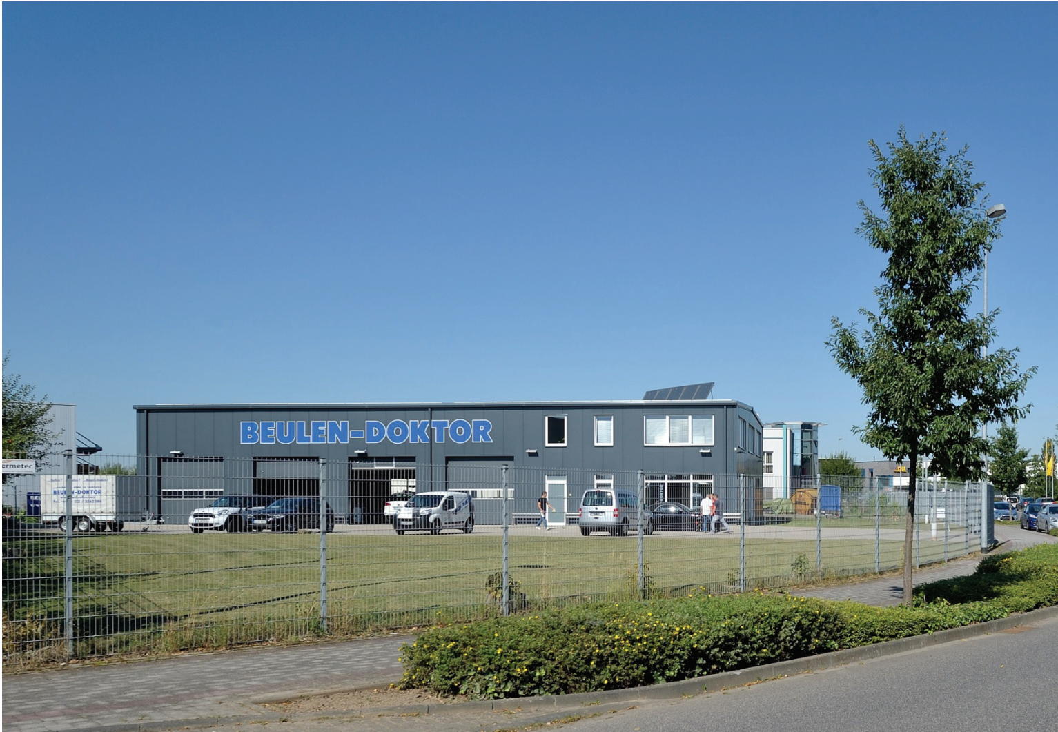
Junkersring 58, Beulen-Doctor