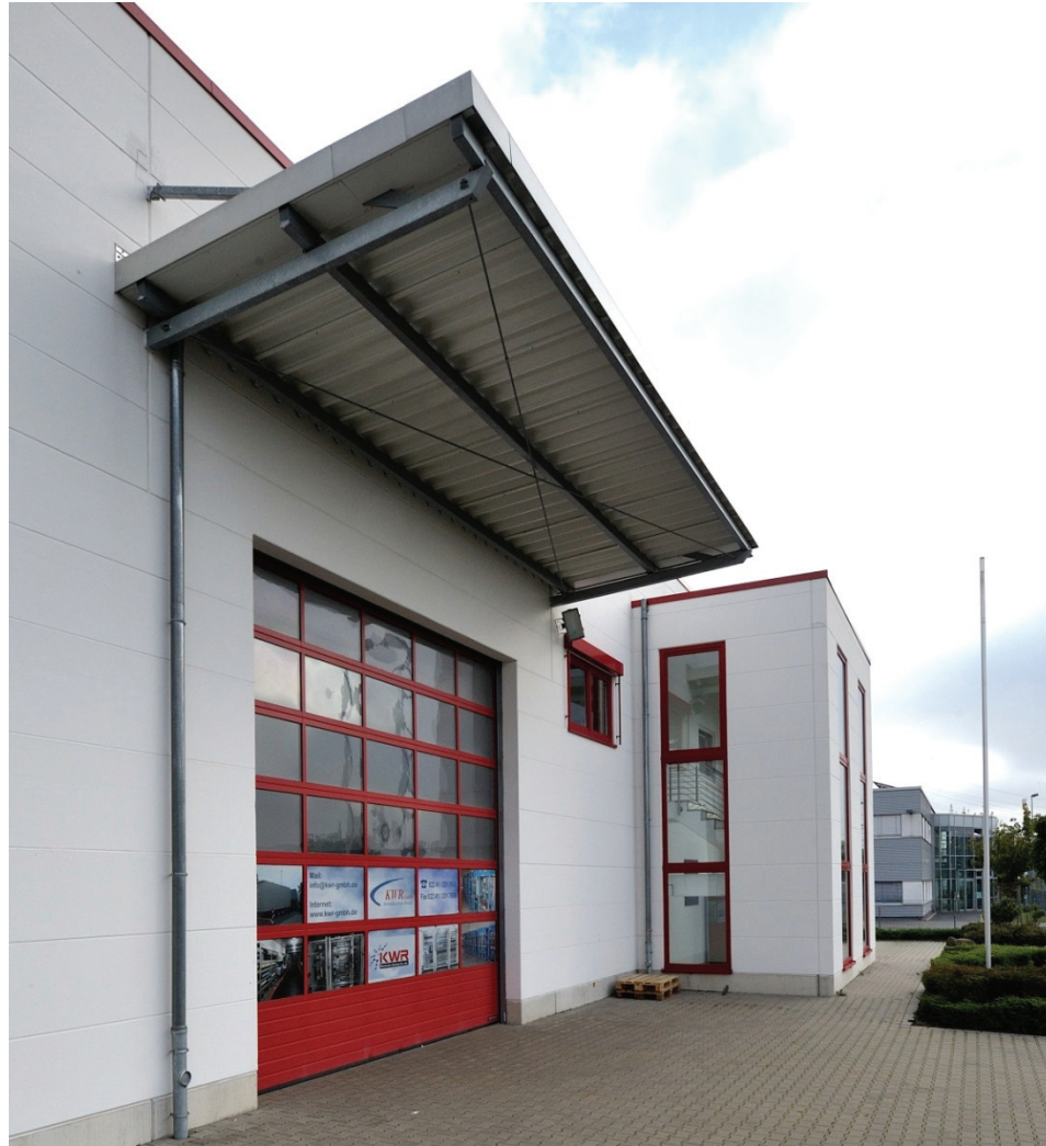
Junkersring 22, KWR GMBH, BILD 2