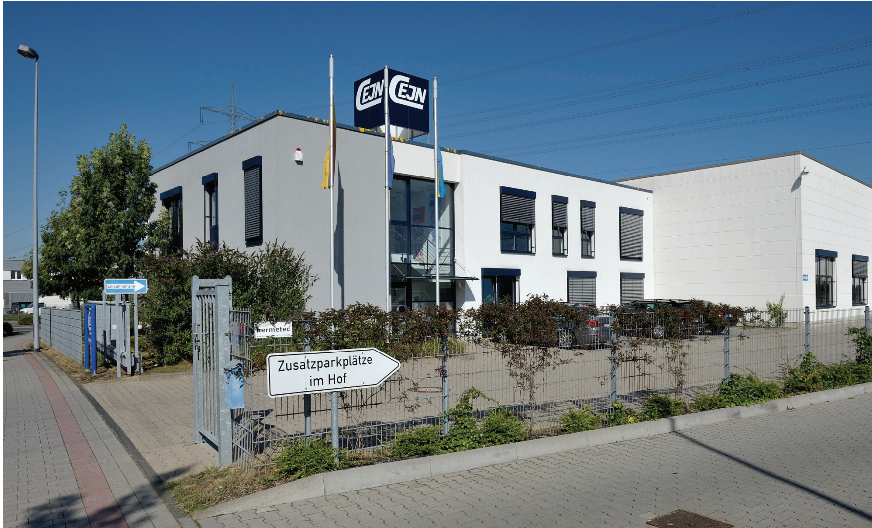
Junkersring 16, cejn-produkt GmbH