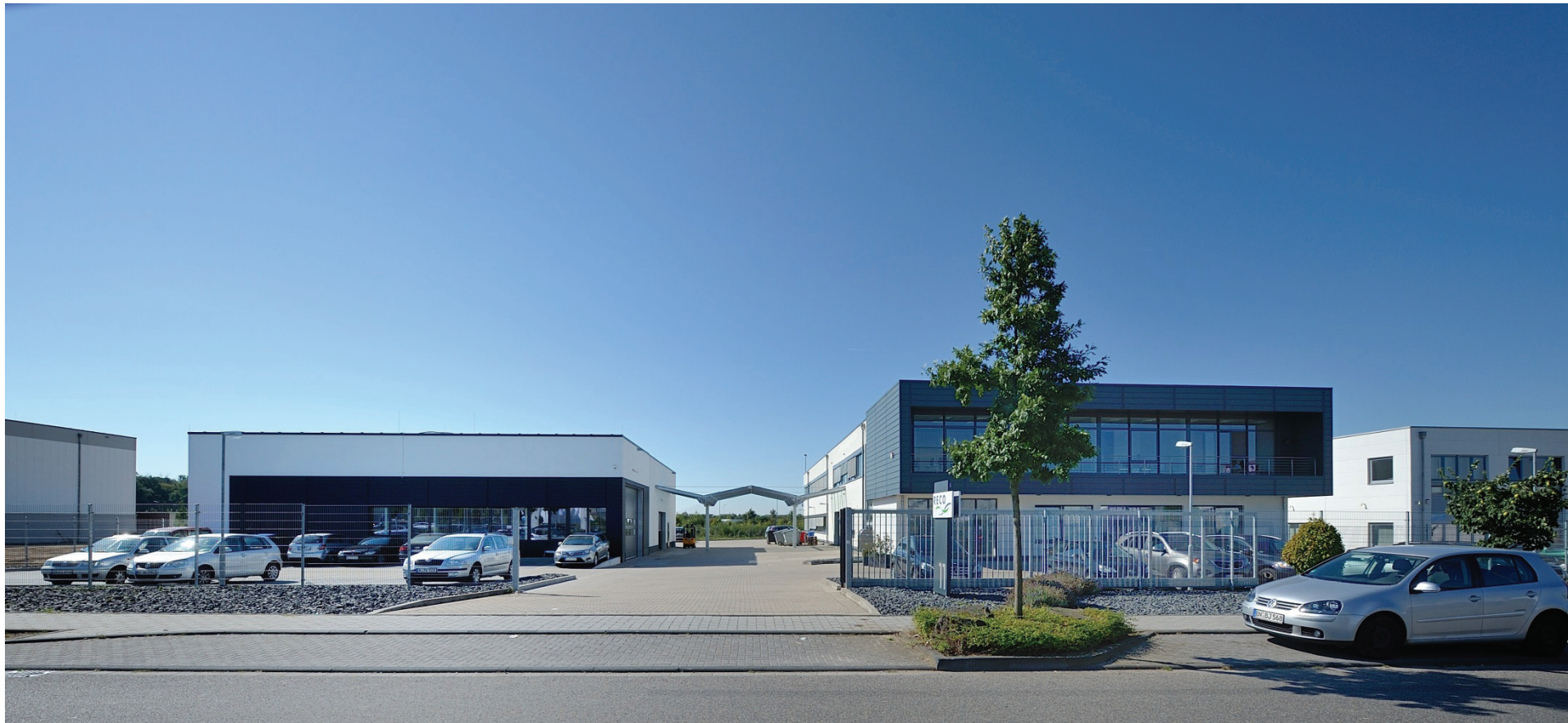
Junkersring 11, RECO Gesellschaft für Industriefilterregelung mbH