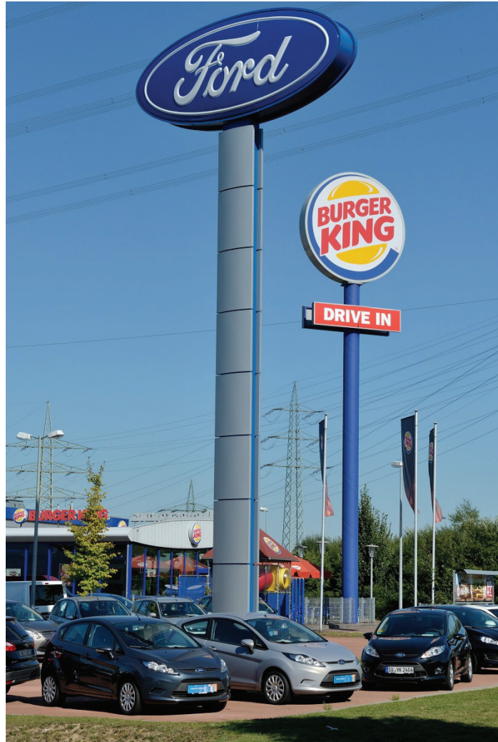
Heinkelstraße, Ford und Burger King