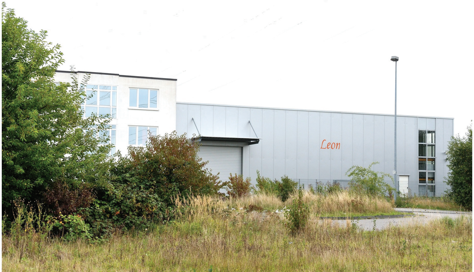
Steinmannweg 5, Leon GmbH