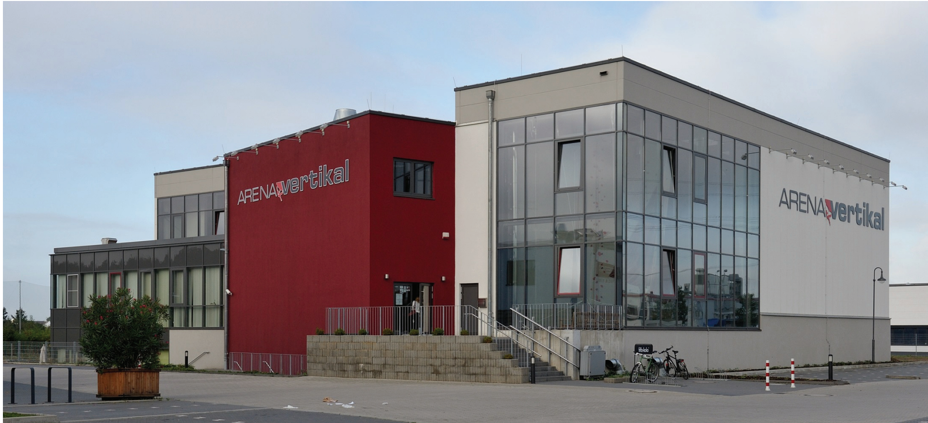
Junkersring 3, Arena vertikál