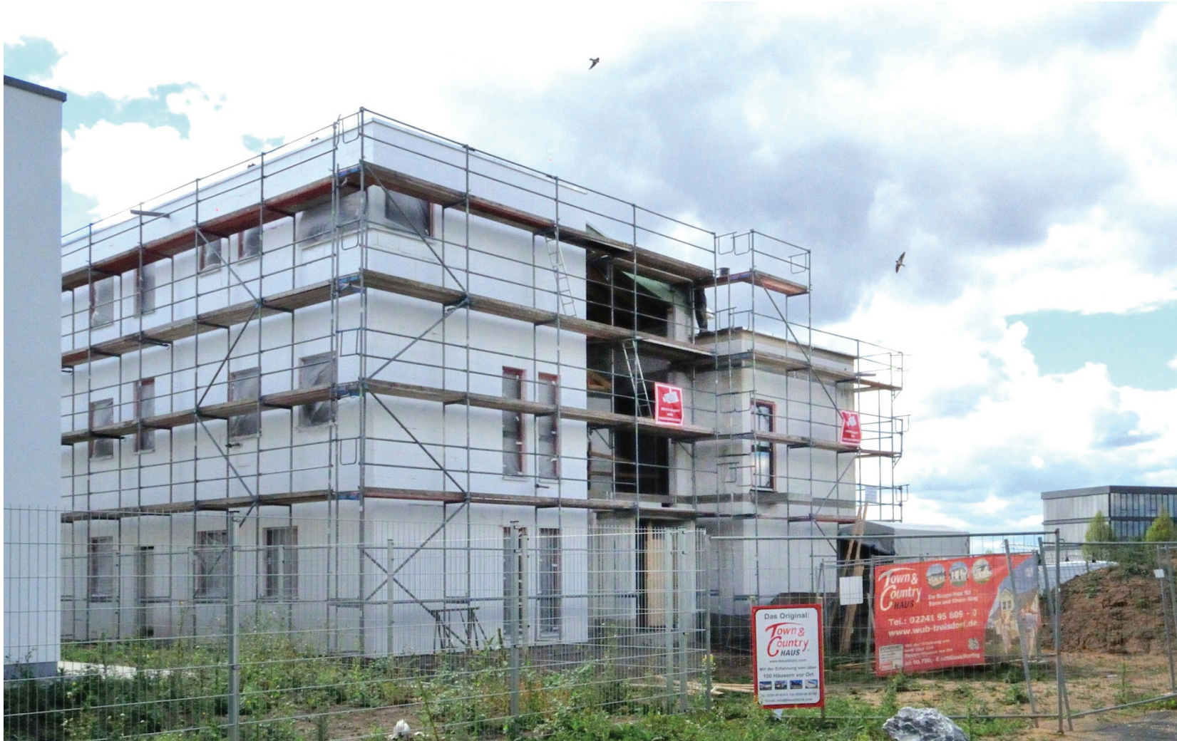
Junkersring 25, Bürogebäude im Bau (Firma Town & Country)