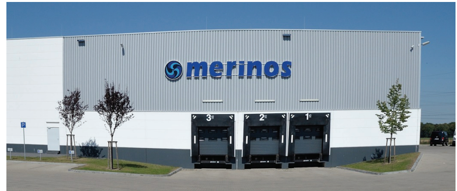
Junkersring 49 und 51, Medipa Group GmbH, oben Gesamtansicht (auf der linken Seite Haus Nr. 49, rechts Haus Nr. 51) Bild unten links: Haus Nr. 49, Bild unten rechts: Verladung an Haus Nr. 51