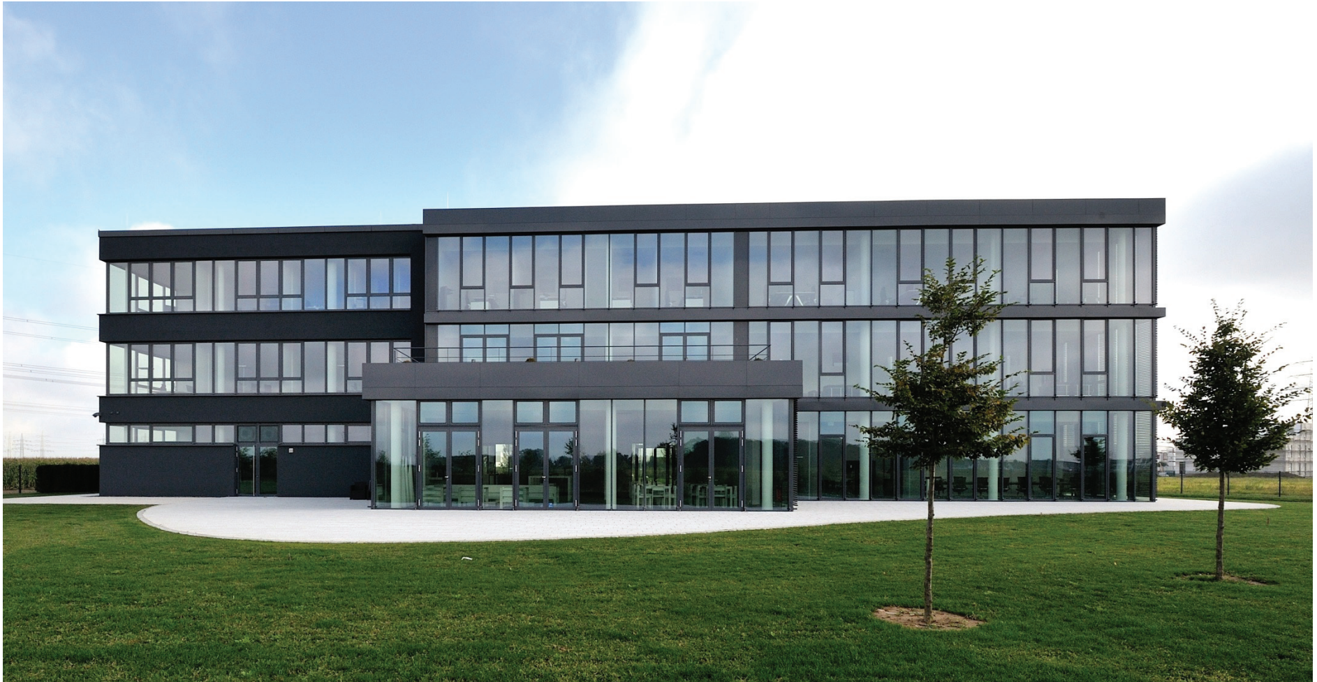
Junkersring 35, Gambit Consulting GmbH, Parkseite