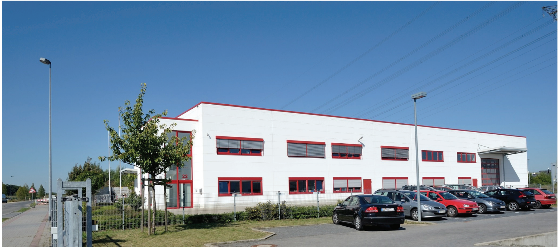
Junkersring 22, KWR GmbH