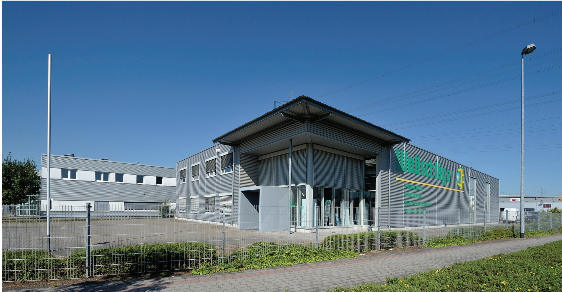
Junkersring 18, Wollschläger GmbH & Co. KG