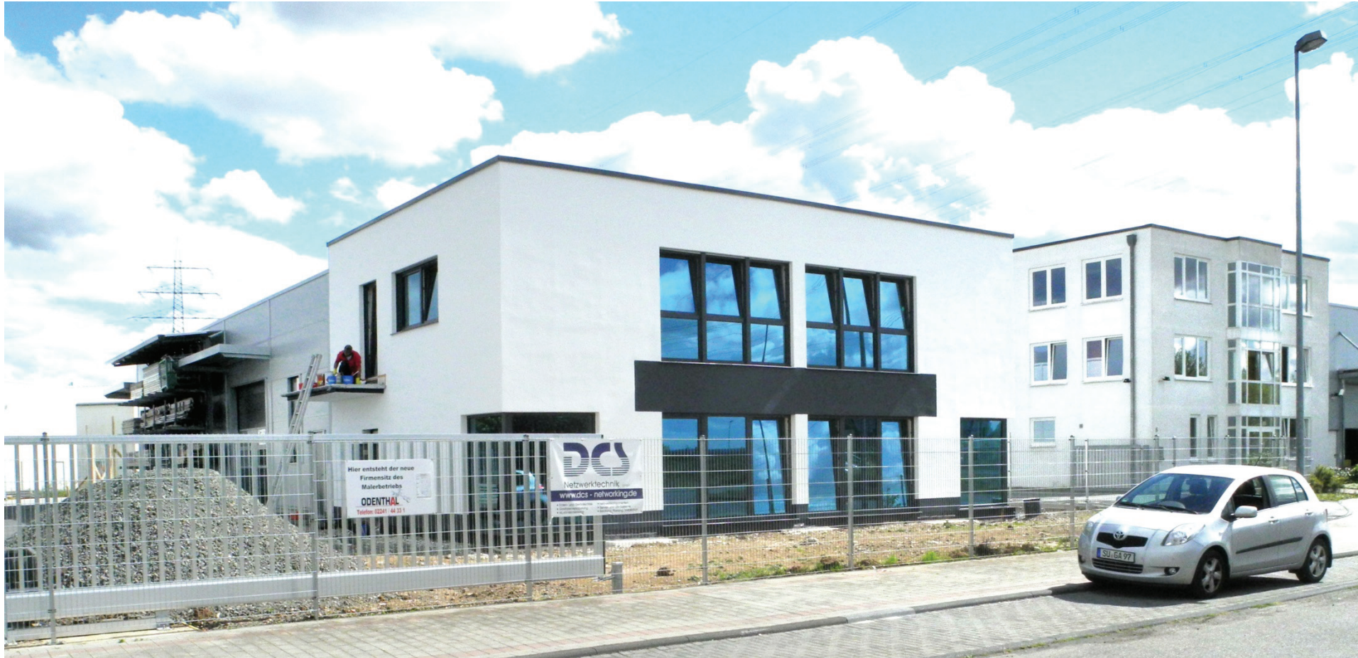
Steinmannweg 3, Malerbetrieb Odenthal, Gebäude kurz vor Bauabschluss, rechts im Bild Gebäude Steinmannweg 5 der Leon GmbH