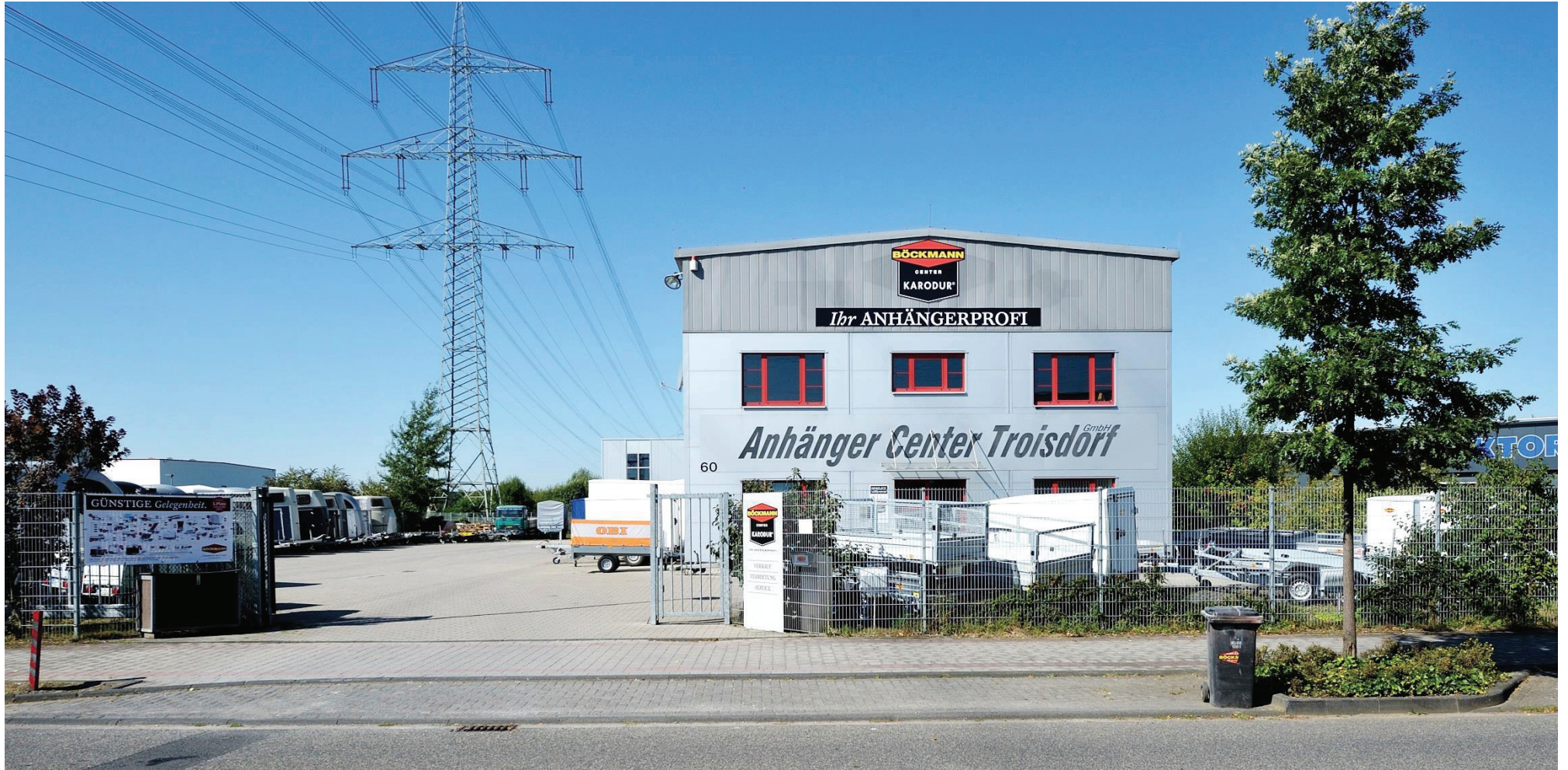
Junkersring 60, Karodur-Anhängercenter GmbH