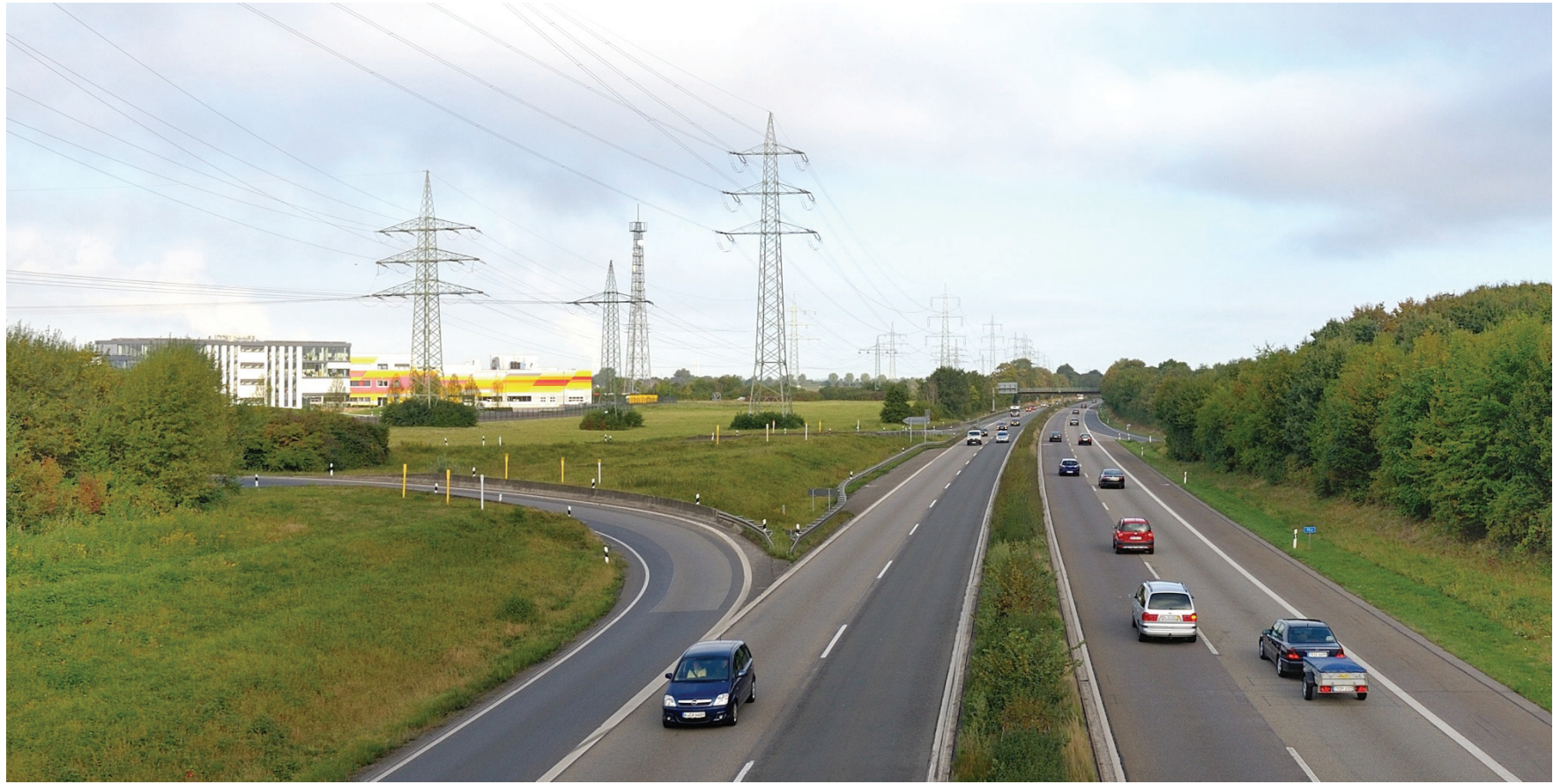
Autobahn 59 (Blickrichtung nach Norden), links der Gewerbepark