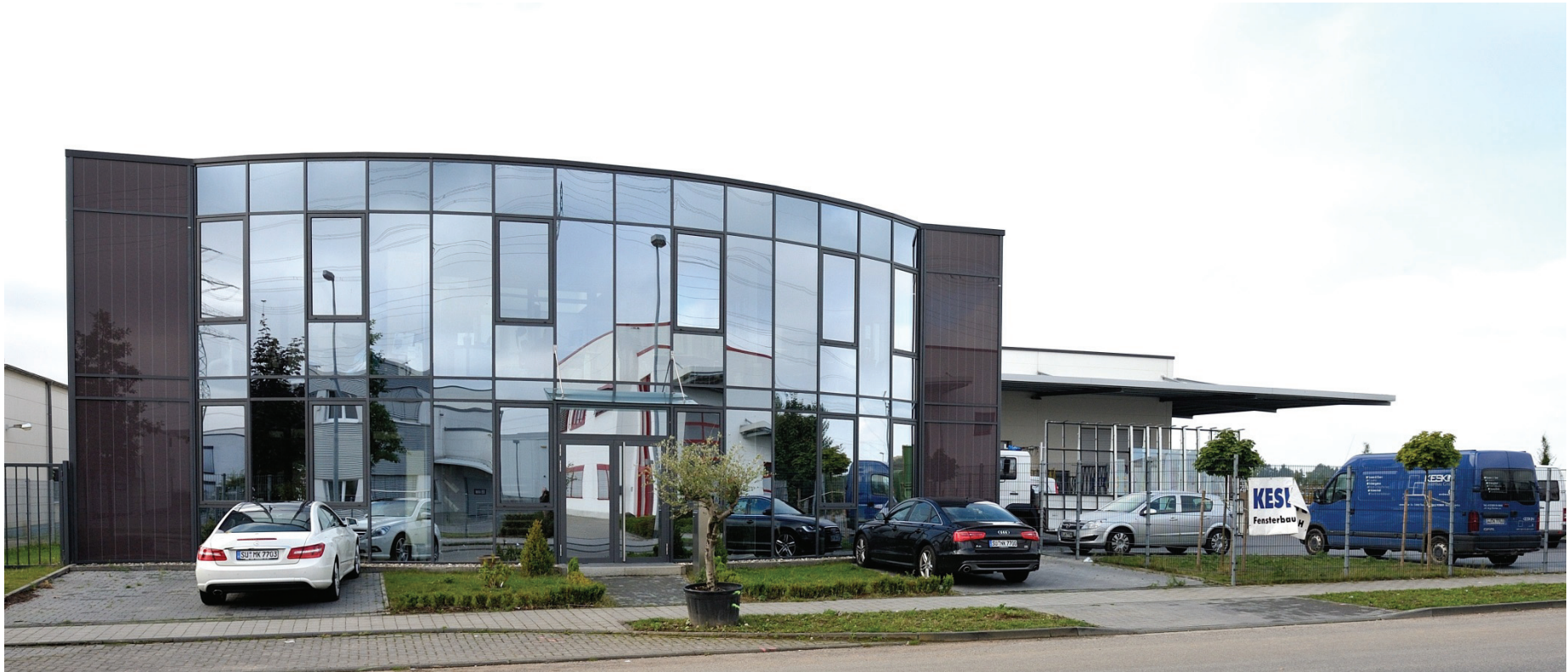
Junkersring 21, Keskin Fensterbau GmbH