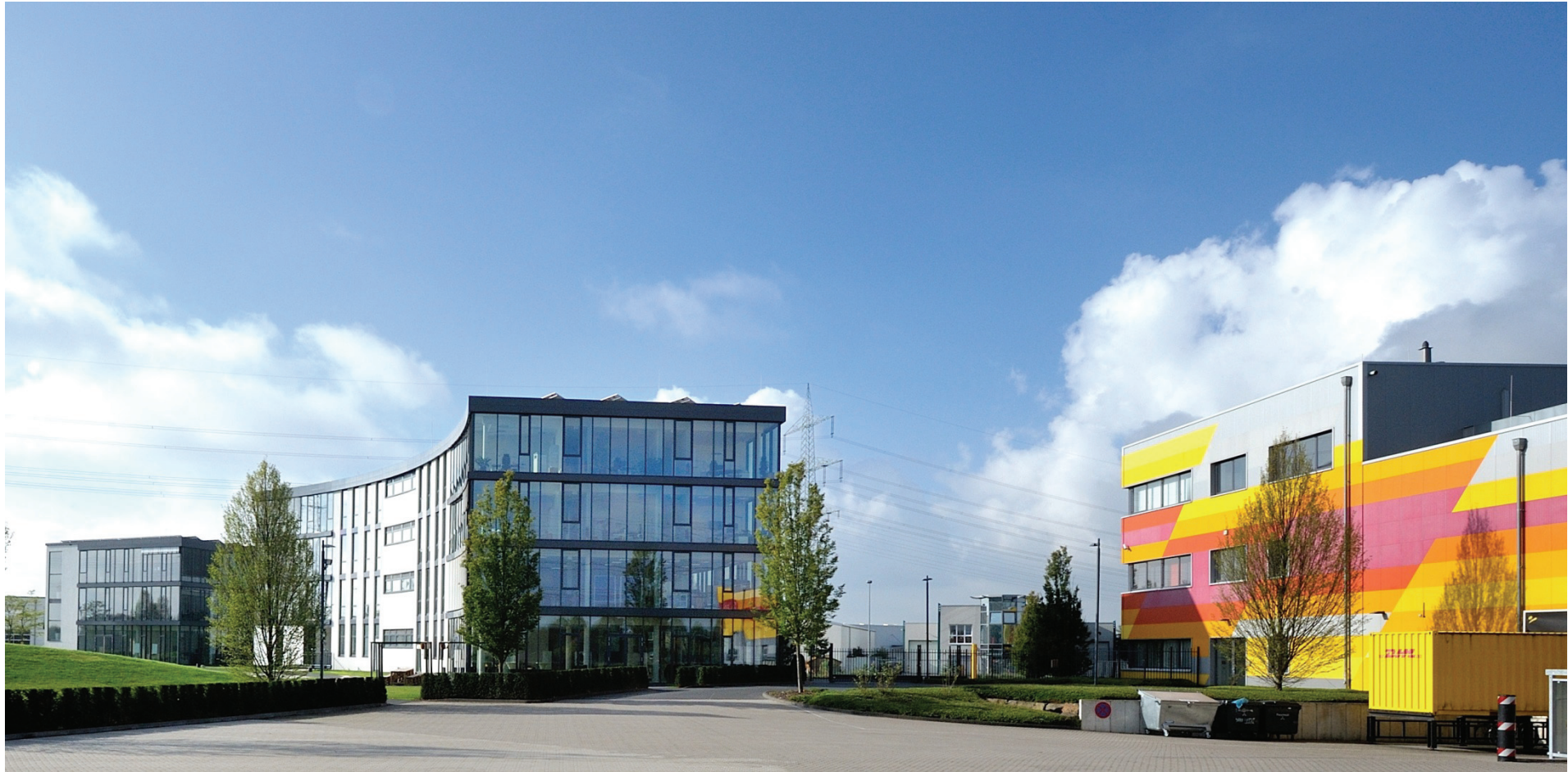
Der DHL-Gebäudekomplex: links Nr. 63, Mitte Nr. 57, rechts Nr. 55