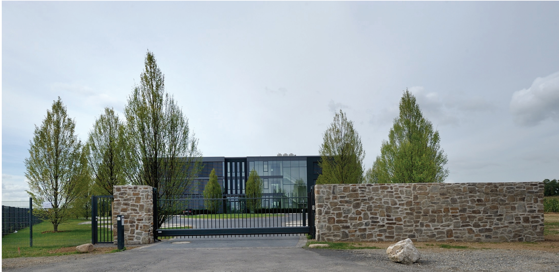
Junkersring 35, Gambit Consulting GmbH, Bild 2: Straßenseite des Gambit-Hauses