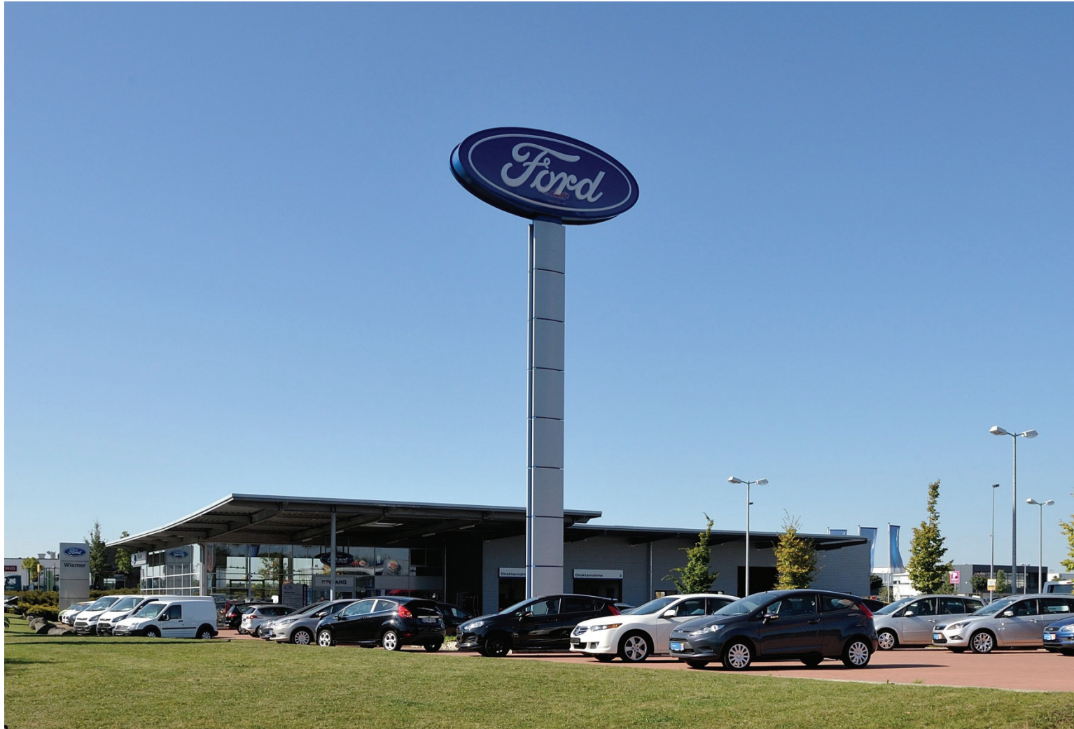
Heinkelstraße 2, Autohaus Wiemer GmbH