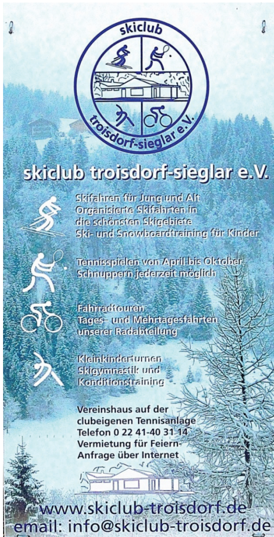
Skisport, Tennis, Radfahren, Turnen