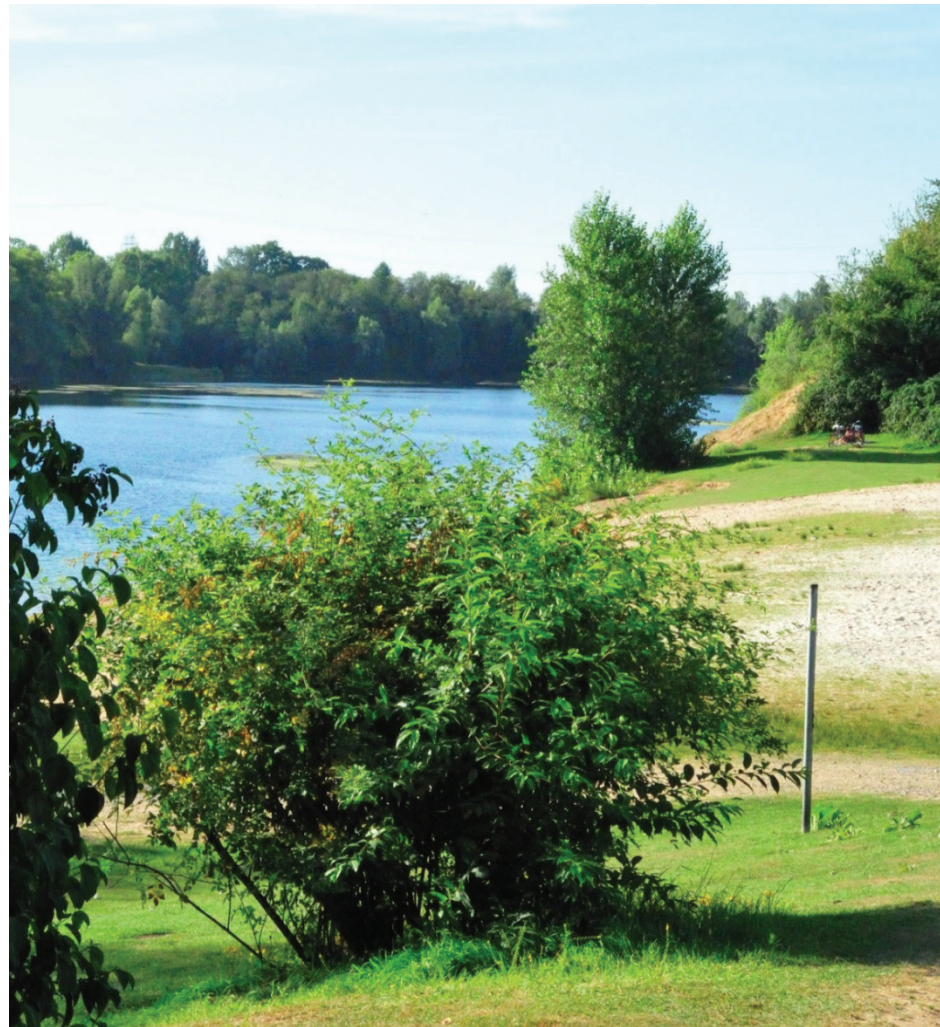
Schwimmsport am Rotter See