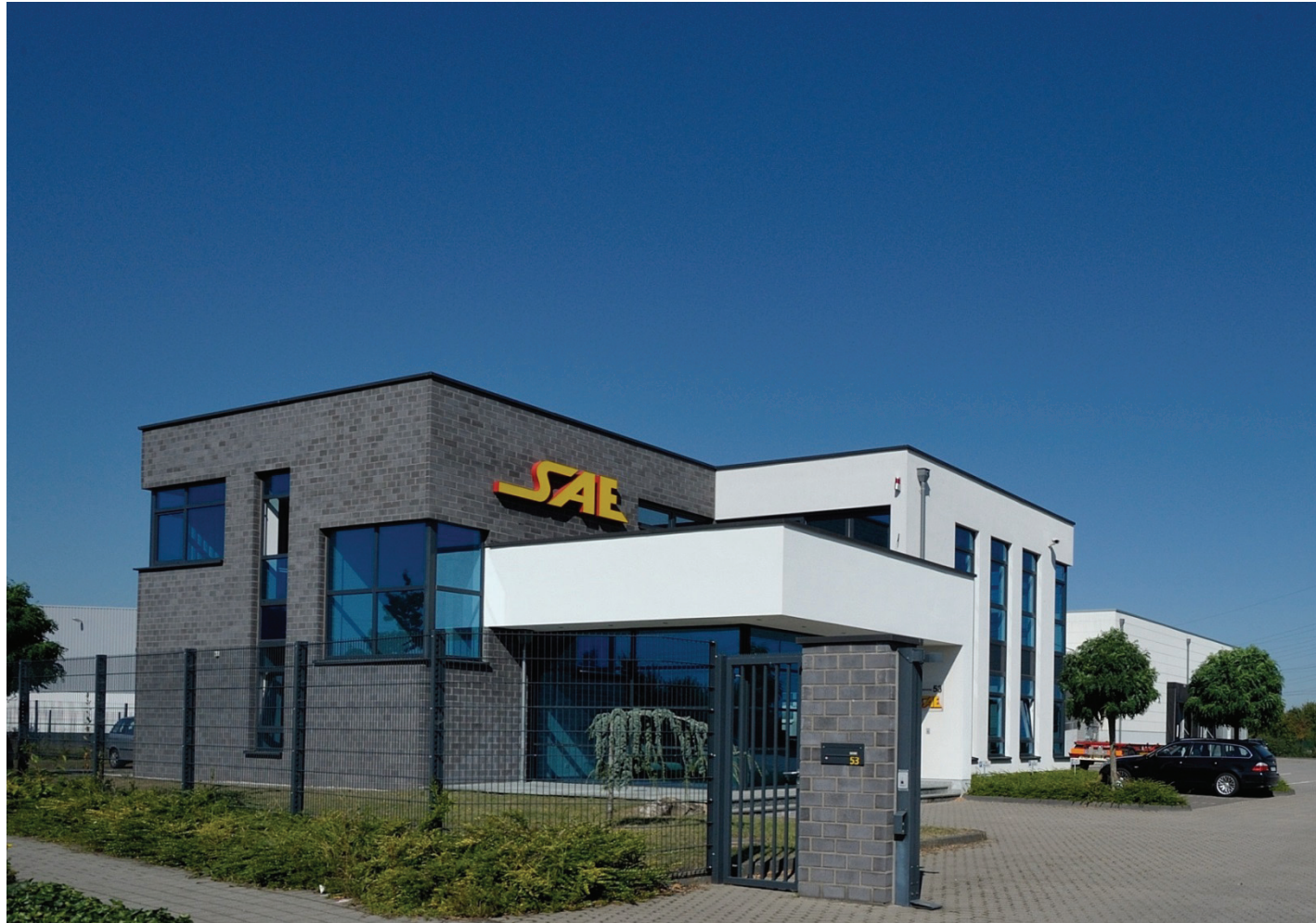
Junkersring 53, S.A.E. Speditions GmbH