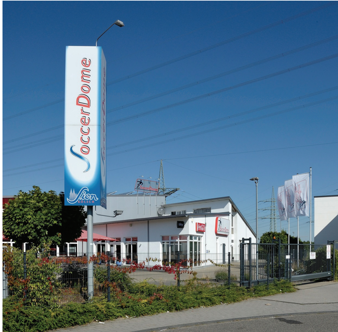
Heinkelstraße 3, Soccer Dome