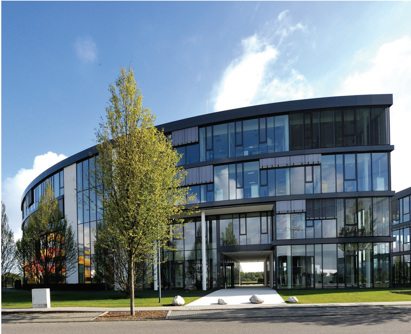
Junkersring 57, DHL Central Building