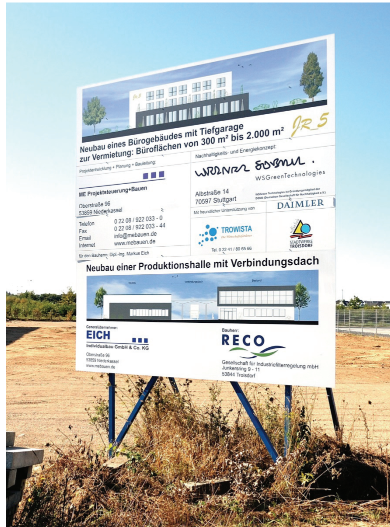
Junkersring 5, Bürogebäude mit Tiefgarage (im Bau)