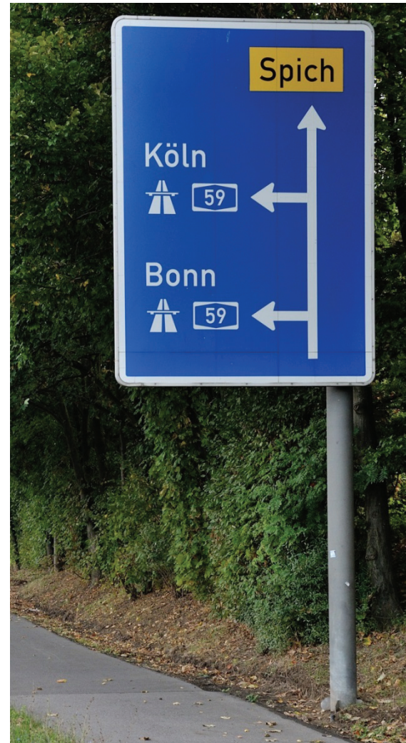
Autobahn 59, Anschlussstelle Spich