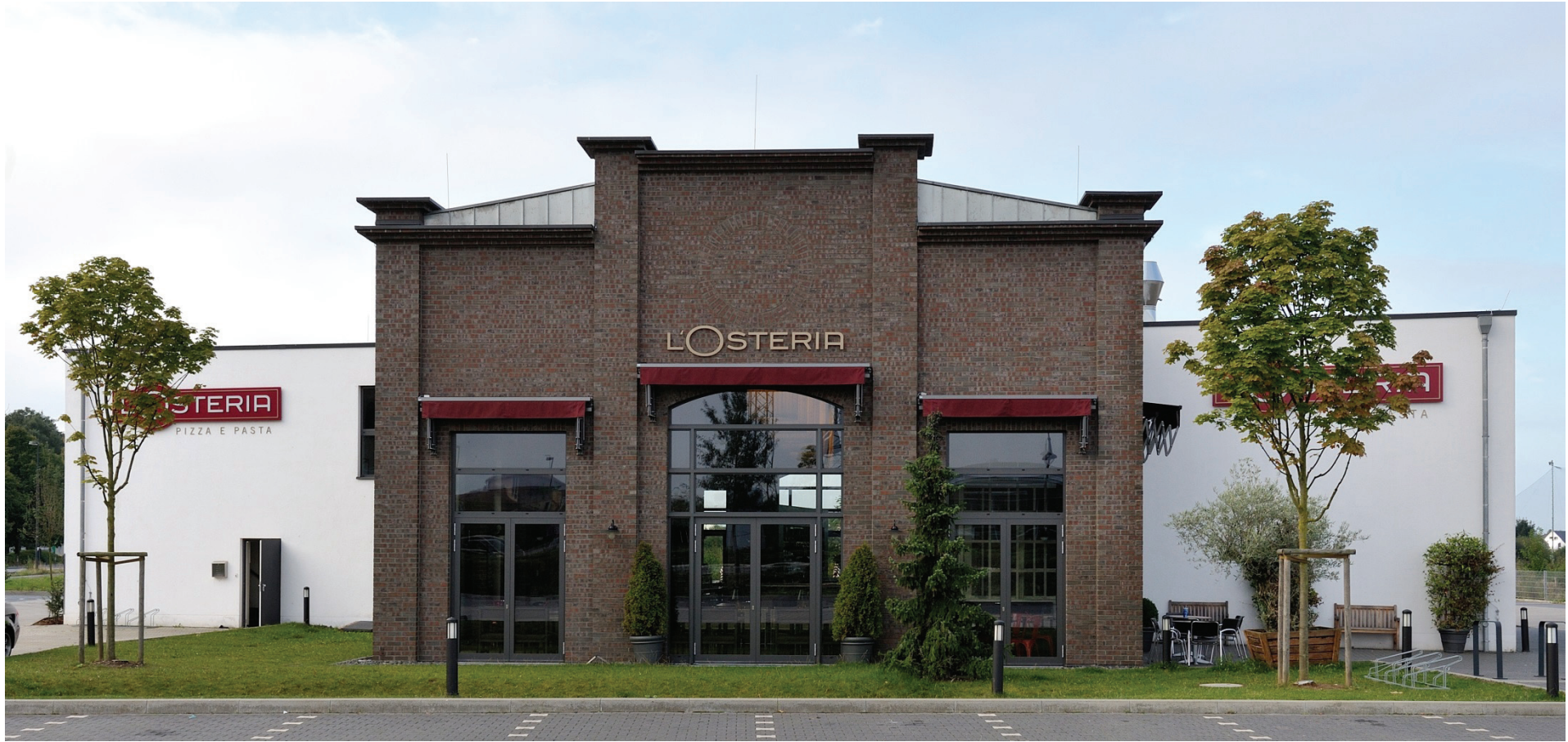
Junkersring 1, L'Osteria