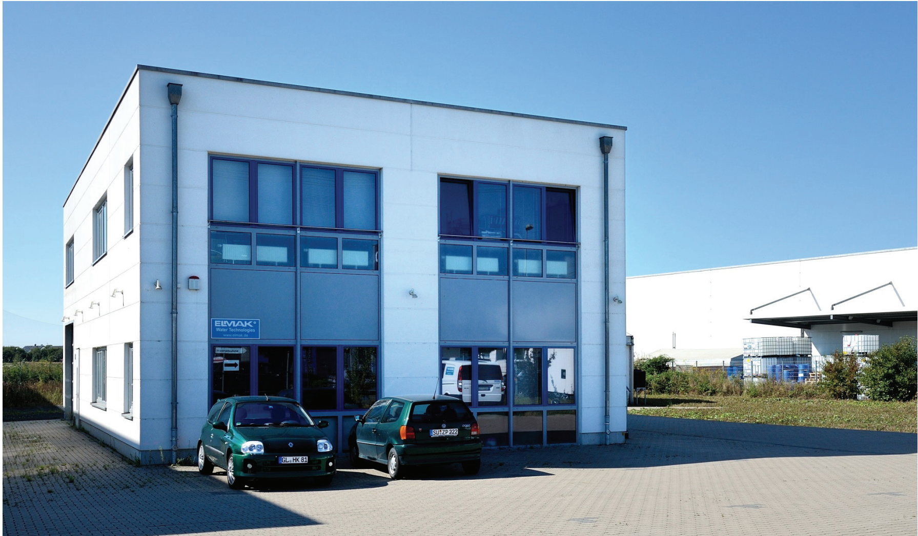
Junkersring 13, ELMAK Wassertechnik GmbH