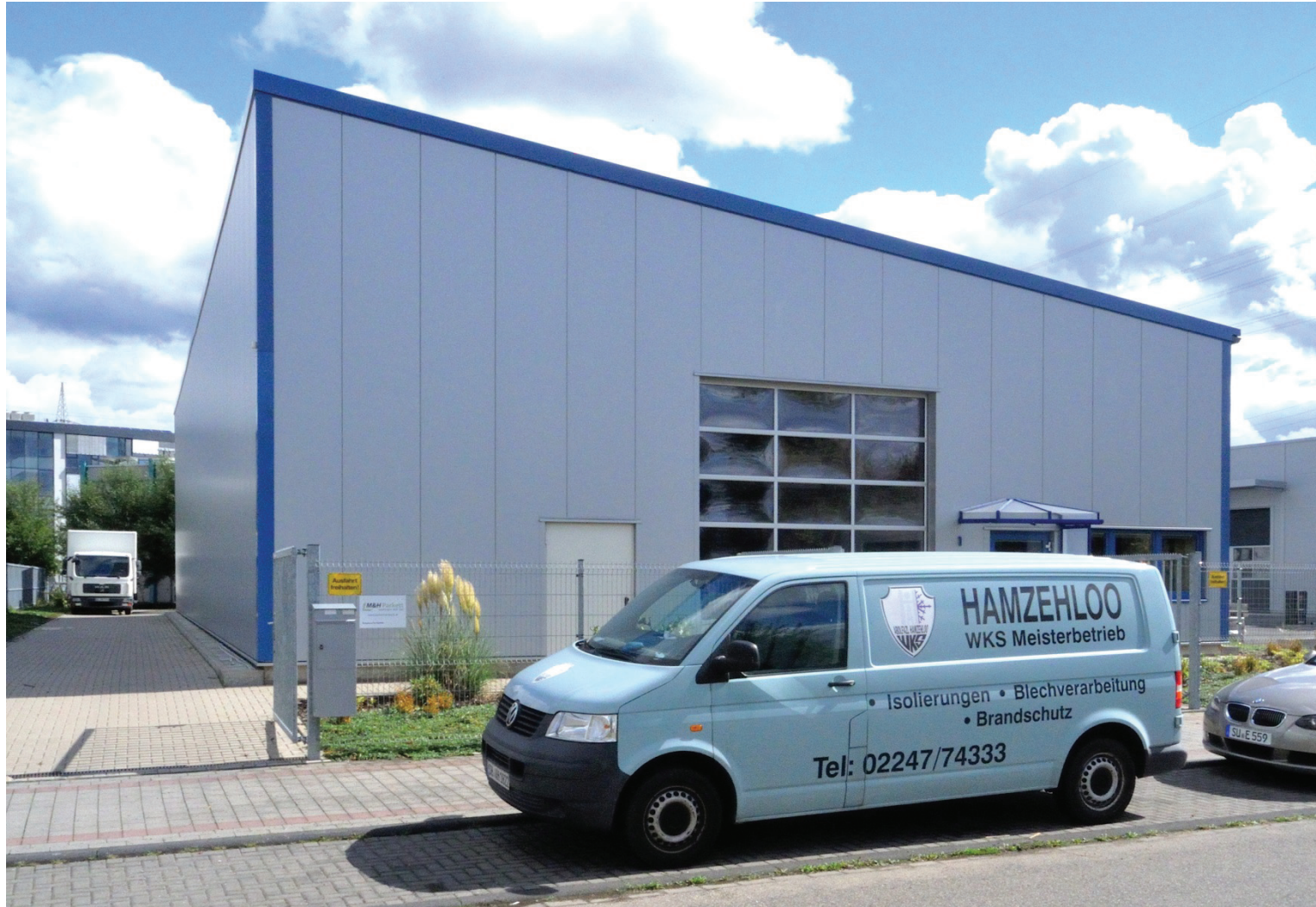
Steinmannweg 1, Hamzehloo und H&M PARKETT KG