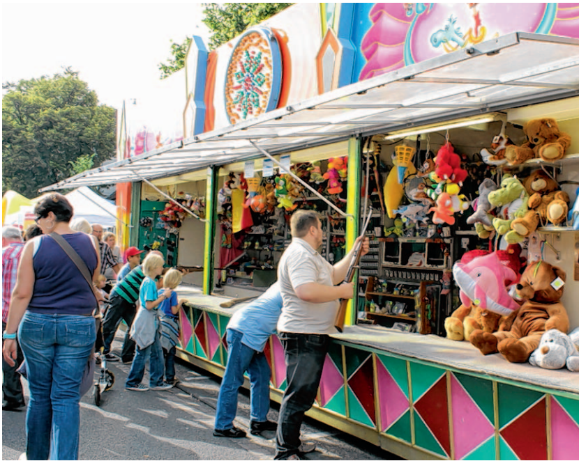
Auch klassisches Kirmesvergnügen ist in Kohlscheid vom 5. bis 7. September möglich.