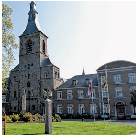
Die Herzog-Limburg-Gedenksäule an der Abtei Rolduc ist der Ausgangspunkt.

Diese 14 Kilometer lange Wanderung startet an der Abtei Rolduc in Kerkrade, eines der größten denkmalgeschützten Gebäude der Niederlande. Gewandert wird teils über deutsches Gebiet, kommend von Rolduc geht es in Richtung Hamstraat, durch das Hambachtal Richtung Horbach, am Amstelbach entlang über Kohlscheid Ortsende Richtung „Gut Obermühle“, wo eine Pause eingelegt wird. Am Amstelbach entlang durch Wald und Wiesen und über die Hamstraat führt die Wanderung zurück zur Abtei Rolduc. Die Teilnehmer können sich am 30. August ab 9 Uhr morgens in der Aula Minor, gelegen am Vorplatz der Abtei Rolduc, Heyendallaan 82, in Kerkrade, anmelden. Die Wanderung startet unter Begleitung um 9.30 Uhr von der Herzog-Limburg-Gedenksäule auf dem Vorplatz aus. Es gibt unterwegs einen Haltepunkt, an dem etwas zu Trinken und zu Essen preiswert angeboten wird. Ab 15 Uhr startet das musikalische Weinfest im Innen-