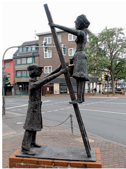
„Der Malermeister und seine Gesellin“ lautet der Titel der Malerskulptur an der Geilenkirchener Straße in Herzogenrath.

Es zeigt die originalgetreue Nachbildung einer alten Schachanlage. Diese steht sinnbildlich für die Kohlscheider Bergbaugeschichte. Das Becken hat einen Durchmesser von 3,50 Meter. In der Mitte erhebt sich der 4,80 Meter hohe Förderturm, an dessen Fuß drei Bergleute stehen. Sie halten das Förderseil. Den Brunnenrand zieren zwölf reliefartige Darstellungen zur Ge-