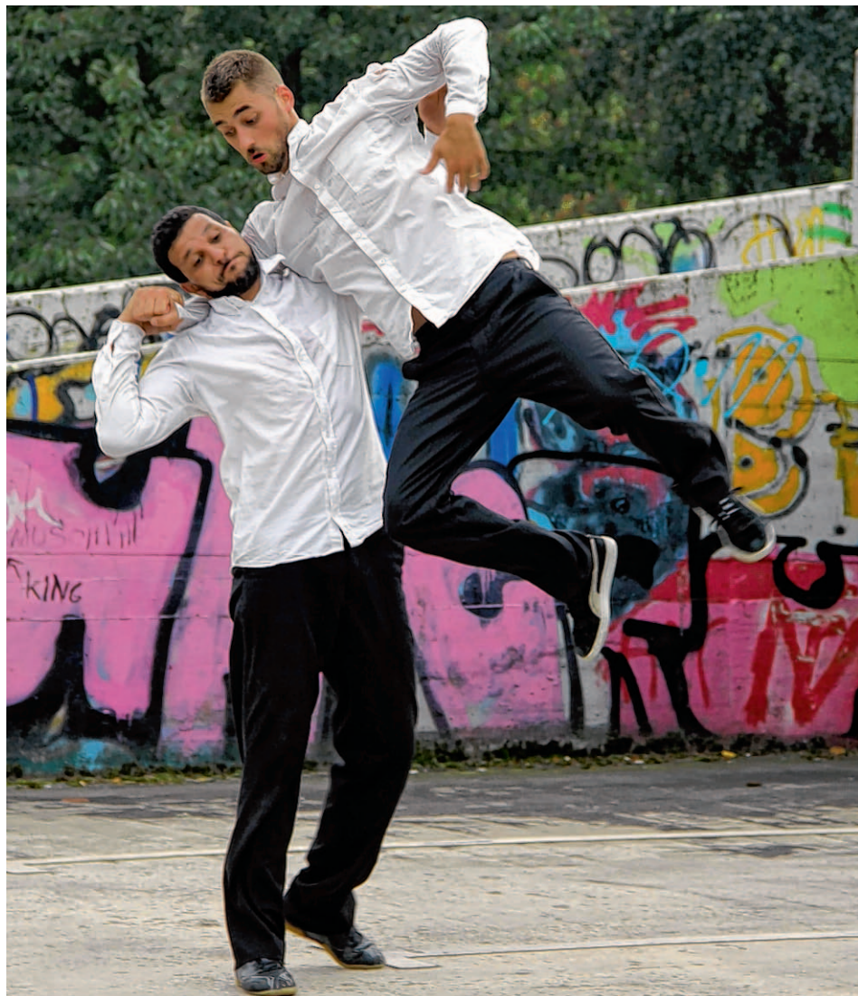
Öffentliche Plätze bilden die Kulisse der Tanzdarbietungen.