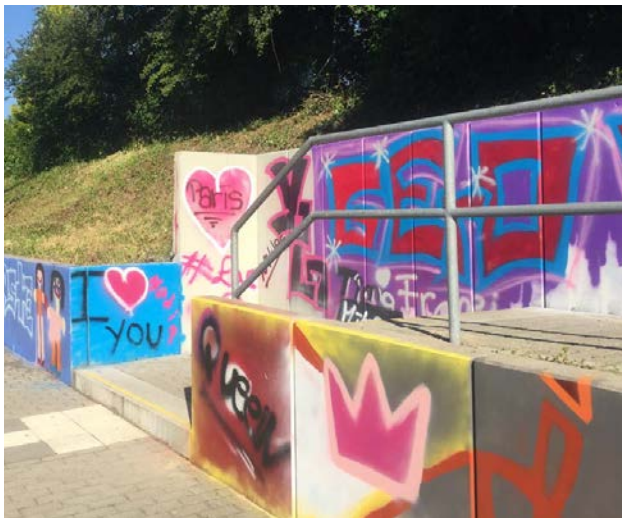
Die Euregiobahn-Haltestelle in Merkstein wurde bei einem Graffiti-Projekt verziert.

Dank der großzügigen Spende der Euregioverkehrs-schienennetz GmbH konnten zahlreiche Sprayfarben gekauft werden und die Jugendlichen Sprayer konnten sich nach Herzenslust austoben. So entstanden zahlreiche bunte Bilder, die von nun an die Haltestelle in Alt-Merkstein verzieren.