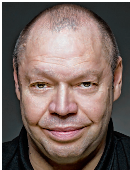
Bassbariton Thomas Quasthoff erhält die Martin Buber-Plakette.

Ihn als Gesprächspartner, Sänger, Schauspieler und Redner zu erleben sei faszinierend und begeisternd, ist das Kuratorium der Martin-Buber-Plakette sicher. „Der Zuhörer erfährt ihn als einen Menschen, der sich aufs Sorgfältigste um das Wort kümmert“, wird weiter erklärt. Über seine Prominenz sei es ihm auch gelungen, angesichts einer beispiellosen Flüchtlingswelle, Friedensbemü-