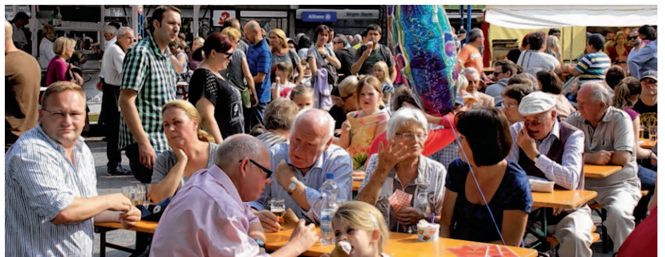
Das Stadtfest in Kohlscheid ist Anziehungspunkt für Besucher aus Nah und Fern.