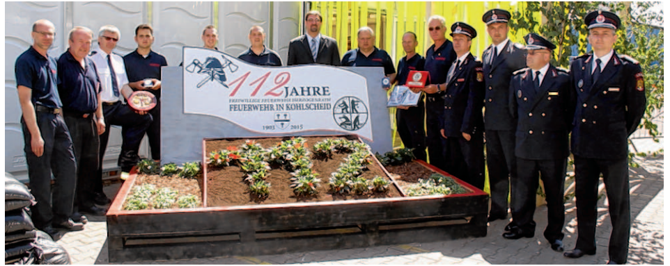
Der Löschzug Kohlscheid der Freiwilligen Feuerwehr feierte sein 112-jähriges Bestehen auch mit der Vorstellung eines entsprechend bepflanzten Beetes.

Ein Hersteller für Feuerwehrfahrzeuge stellte zeigte eines der derzeit modernsten Löschgruppenfahrzeuge vor und darüber hinaus ein geländegängiges Quad, welches als Kleinlöschfahrzeug ausgestattet wurde. Die niederländischen Kollegen der Brandweer Zuid Limburg zeigten eine Möglichkeit, Wasser über lange Wegstrecken zu transportieren. Viele weitere Sonderfahrzeuge auch