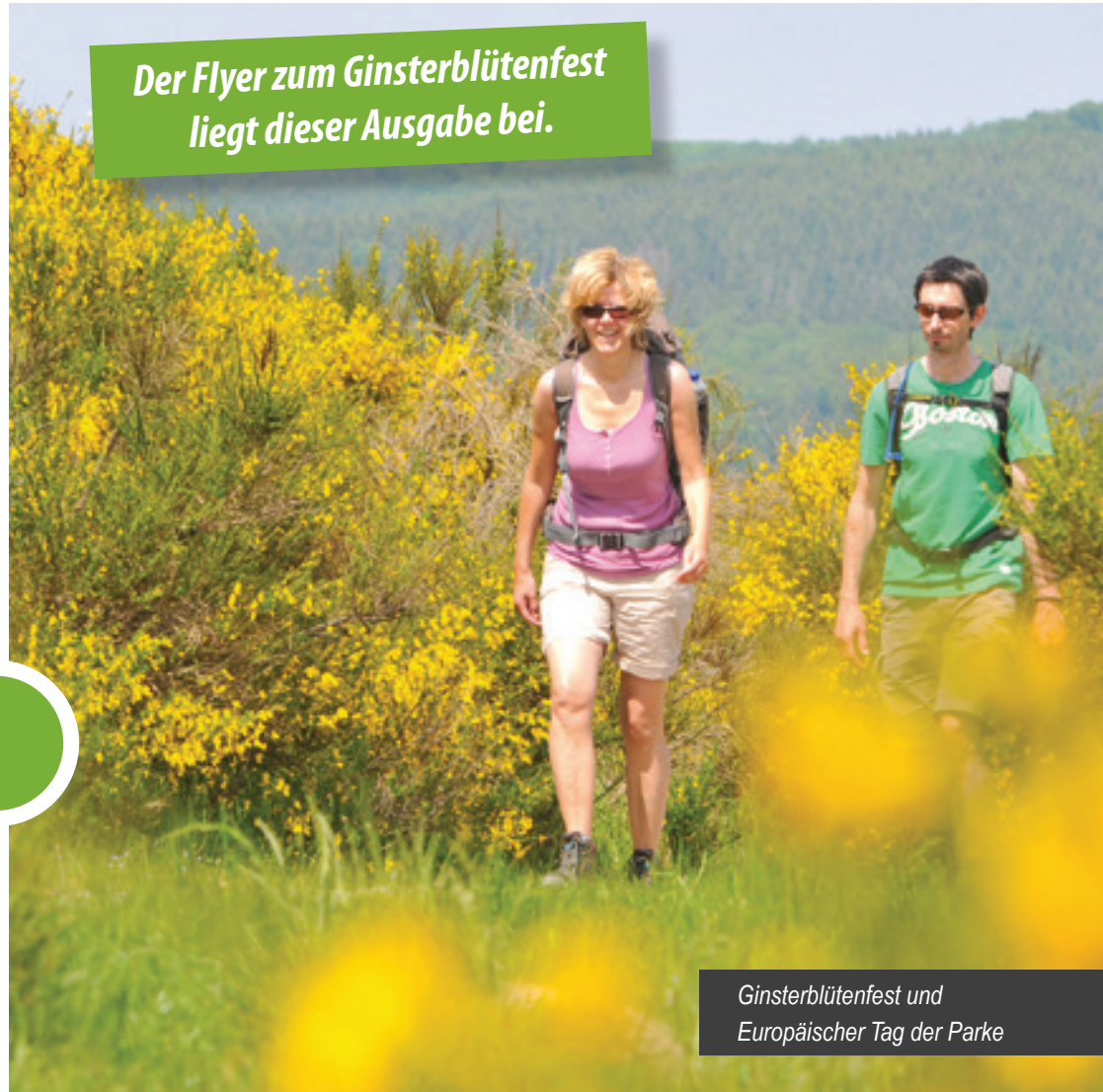
Ginsterblütenfest und Europäischer Tag der Parke

Der Flyer zum Ginsterblütenfest liegt dieser Ausgabe bei.