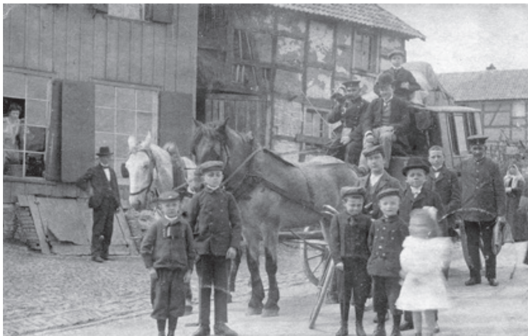
Die Postkutsche mit dem Postillon und seinem Posthorn in Dreiborn. Vermutl. vor 1910.

Das Bild einer Postkutsche aus dem Bildbestand des Geschichtsforums Schleiden (GFS) weckt in uns Erinnerungen an eine vergangene Zeit, als das Leben bei weitem nicht so hektisch war wie heutzutage. Womöglich ist es diese „Entschleunigung“, die uns heutigen - von der tickenden Uhr getriebenen Menschen - das Eifeler Landleben anno dazumal als vermeintlich „gute alte Zeit“ erscheinen lässt. Tatsächlich war das damals gemächliche Fortkommen natürlich nicht gewollt, es fehlten in Wahrheit nur die technischen Voraussetzungen für das schnellere und bequemere Reisen. Seit es die ersten Menschen in der Region gab, hatten die eigenen Füße für die große Mehrheit das übliche Fortbewegungsmittel gebildet. Da war die Einführung der ein- oder zweiachsigen Briefpostwagen, die auch Personen befördern durften, schon eine deutliche Verbesserung. Diese Kutschen verkehrten im preußischen Gebiet als „Karriolpost“ auf den Nebstrecken ohne Bahnanschluss. Die Einrichtung war eng mit dem Postwesen verbunden. Wie Alfred Wolter, Orthshistoriker für den Bereich Dreiborn, berichtet, wurde zum 1. Juli 1884 im Dorf eine Telegraphen-Betriebsstelle eingerichtet, zwei Jahre später folgte bereits eine Postagentur im