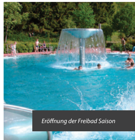
Eröffnung der Freibad Saison