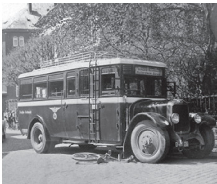
Abgelöst wurden die Postkutschen seit Mitte der 1920er Jahre durch Busse der „Kraftpost“.