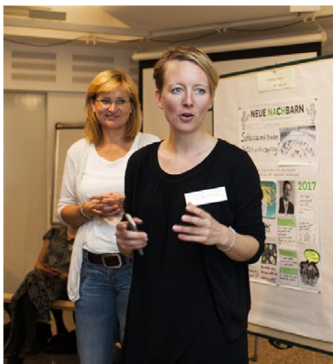
Intensiver Austausch, Spaß und konzentriertes Arbeiten – in vier verschiedenen Workshops konnten die Teilnehmer ihre Projekte weiterentwickeln.

Eine nachhaltige Finanzierung stammt im besten Fall aus verschiedenen Quellen und sollte zu Beginn des Projektes angestrebt werden. Sie kann sich aus Mitteln aus öffentlichen Fördertöpfen oder privaten Stiftungen, Einnahmen aus wirtschaftlichen Tätigkeiten, Spendenaktionen, Mitgliedsbeiträgen oder anderen Quellen zusammensetzen. Je unterschiedlicher die Finanzierungsquellen sind, desto flexibler kann auf mögliche Veränderungen innerhalb und außerhalb des Projektes reagiert werden. Was aber können Initiativen machen, die strukturell wirksam werden, eine Immobilie kaufen oder nutzen möchten? Nicht selten werden für den Er-