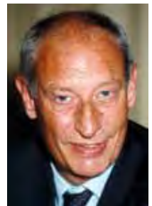
Klaus Laepple Präsident des Bundes- verbandes der Deutschen Tourismuswirtschaft