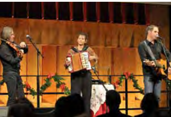
„De Familich“ eröffnete den Abend.

„Erstaunlich, dass schon wieder ein Jahr vorbei ist.“ Das hörte man mehrfach beim Sektempfang vor dem KOMED-Saal. Man sieht sich, man trifft sich, man erzählt und man ist auf jeden Fall dabei, wenn's zur LebensWert-Weihnachtsgala geht. Ein Fest, das alle verbindet, die sich im Verein LebensWert engagieren – von den Mitgliedern über den Vorstand und den Beirat bis hin zu den Förderern des Vereins, aktuellen und ehemaligen Patienten und so manchen Kölner Bürgern, die sich für die Arbeit des Vereins interessieren.