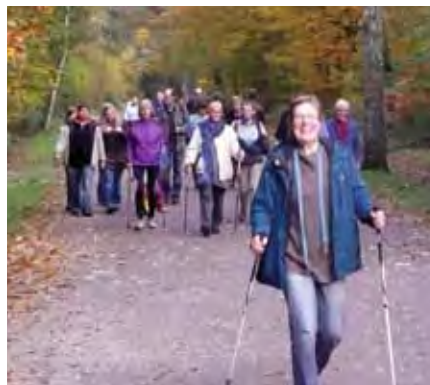
Gute Stimmung beim Onko-Walk 2011. Was sind schon 118,04 Höhenmeter?

Bei trockenem Wetter und milden Temperaturen ging es morgens los, um dann nach der ersten Kaffeepause bei Kilometer drei die angekündigte Besteigung des Monte Troodelöh in Angriff zu nehmen. Dadurch entstanden nicht nur mehr Höhenmeter, sondern auch eine um ca. 1,2 Kilometer längere Gesamtstrecke. Die Teilnehmer, die bei der Besteigung noch über genügend Sauerstoff- und Kraftreserven verfügten, konnten sich sogar im Gipfelbuch dieser „auffallenden Bergspitze“ verewigen. Zur Überraschung einiger Teilnehmer ging es dann sogar noch höher, weil die Kölner Stadtgrenze überschritten und der Rheinisch-Bergische Kreis betreten wurde. Neben dieser „Bergstrecke“ gab es natürlich, wie in den