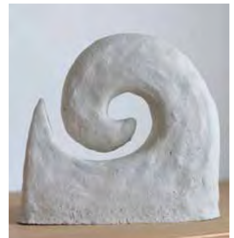
Diese Skulptur entstand in der Kunsttherapie und war Vorlage für unser Vereinslogo.

Weitere Informationen erhalten Sie unter 0221 - 478-6478, per Mail unter lebenswert@uk-koeln.de oder auf unserer Homepage www.vereinlebenswert.de .