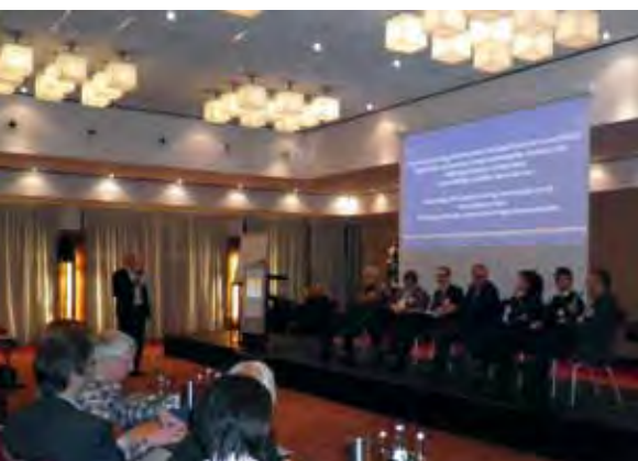
Experten diskutierten über den Status quo der Psychoonkologie.

krankung nach wie vor verbundenen Tabus leiden, durch die psychoonkologische Betreuung in ihrem Selbstbewusstsein gestärkt werden: „Wir erleben es nicht selten, dass sie durch die Behandlung in die Lage versetzt werden, wieder auf andere Menschen zuzugehen und über ihre Erkrankung zu sprechen.“ Auch das wird oft als eine enorme psychische Entlastung erlebt. Die Möglichkeit, ein entsprechendes Hilfsangebot anzunehmen oder aktiv danach zu suchen, sollten nach Rüffer unbedingt Menschen nutzen, die Zeichen einer großen Belastungssituation zeigen. Diese kann sich durch ungewohnte Schweißausbrüche, durch Herzrasen oder durch Nervosität, depressive Stimmungen und große Ängste bemerkbar machen. Wer solche Symptome als Krebspatient an sich bemerkt, sollte mit seinem Arzt über die Möglichkeit einer psychoonkologischen Betreuung sprechen oder eine entsprechende Beratungsstelle oder Einrichtung wie Haus LebensWert aufsuchen. (CV)