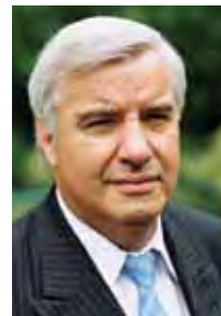
Wilfried Jacobs Vorstandsvorsitzender der AOK Rheinland / Hamburg