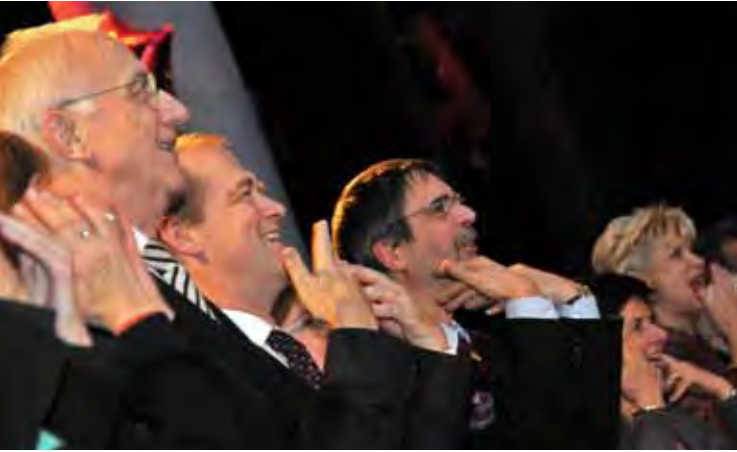
Das Publikum war zum Mitmachen aufgefordert.