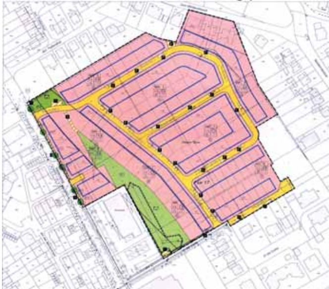
Gemeinde Merzenich Bebauungsplan Nr. C 19b