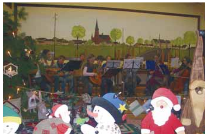
Das neue Golzheimer-Jugend-Orchester stimmte am Abend Aussteller und Gäste mit einigen Musikstücken auf die Weihnachtszeit ein.

Ein Höhepunkt für die kleinen Besucher des Weihnachtsmarktes war jedoch der Besuch des Nikolaus, der nach einer kurzen Weihnachtsgeschichte Leckereien und Äpfel an alle Kinder verteilte.