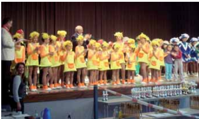
Die Gruppe bei der Siegerehrung.

Für viele Kinder unseres Jugend-Schautanzes mit dem Motto „Enten-Disco“ war die Teilnahme an diesem Tanzturnier überhaupt das allererste Mal in ihrem Leben. Trotz einiger kleiner nervöser Wackler machten die Kinder (6-10 Jahre) ihre Sache gut und erzielten den 2. Platz.