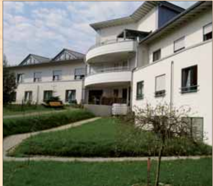
CMS Wohn- und Pflegezentrum Bergeck GmbH

Reichen das Einkommen und die Leistungen der Pflegeversicherung zur Finanzierung der Heimkosten mit Taschengeldpauschale nicht aus, besteht die Möglichkeit, Pflegewohngeld über das Heim zu beantragen.