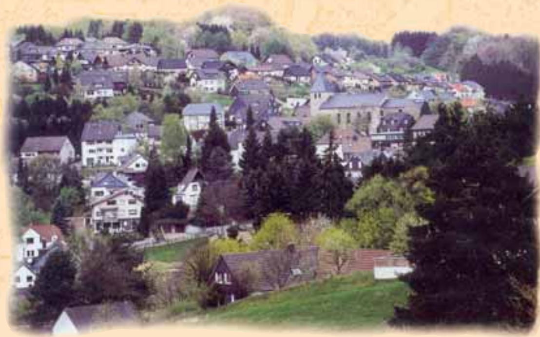
Blick auf Kürten