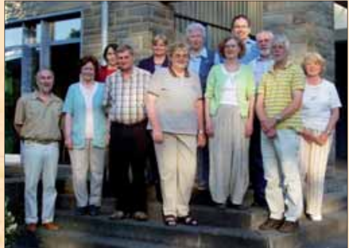
Mitglieder des Senioren- und Behindertenbeirats

Der Senioren- und Behindertenbeirat wirkt u. a. bei der Planung und Gestaltung von kulturellen, sportlichen und geselligen Veranstaltungen für die älteren Bürger/innen mit.