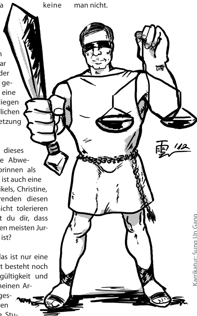
Karikatur: Sung Un Gang

Gärditz: Das ist schwer zu sagen. Es wird ja auch nur alle paar Jahre eine Stelle frei. Wer die dann bekommt, weiß man nicht.