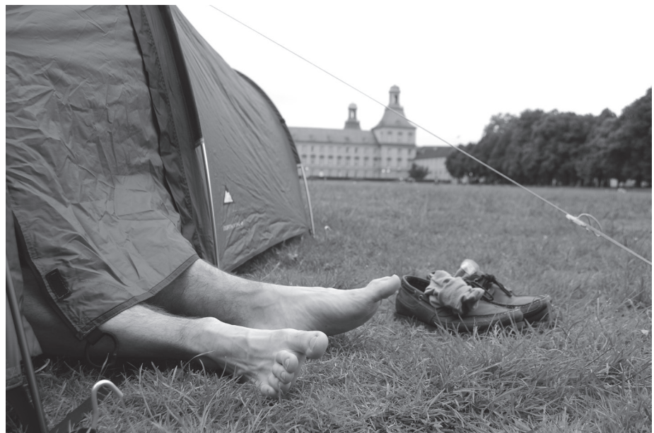
Eine Alternative zu Großmutter's Sofa: Das Zelt im Hofgarten