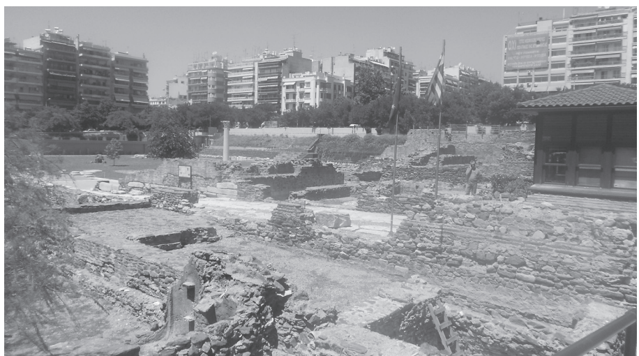
Nicht überall sieht es in Griechenland so aus

Dennoch: Einen gewissen Ärger und Unmut spürt man schon manchmal, doch die meisten Menschen reagieren freundlich und aufgeschlossen, wenn man mit ihnen über die derzeitige Situation sprechen möchte und räumen auch selbst Fehler Griechenlands ein. Andere (wenige) wiederum werden ausfallend,