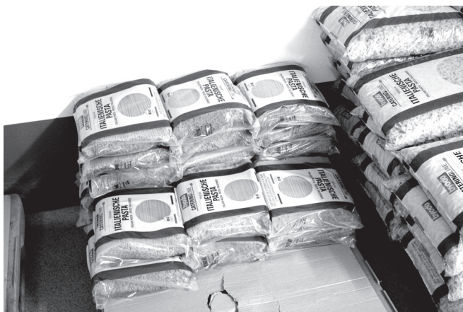
So viele Nudeln werden an einem Tag in der Mensa verarbeitet