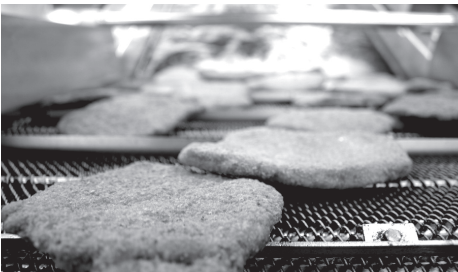
Schnitzel im Anmarsch!