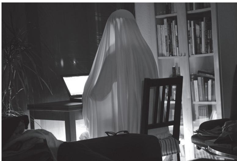
Jetzt auch schon bei Hausarbeiten im Einsatz: Der Ghostwriter

Kurz nach Chatzimarkakis meldete VroniPlag einen erneuten Plagiatsverdacht am heutigen Bonner Institut für Politikwissenschaft und Soziologie. Fast die Hälfte ihrer Dissertation habe die