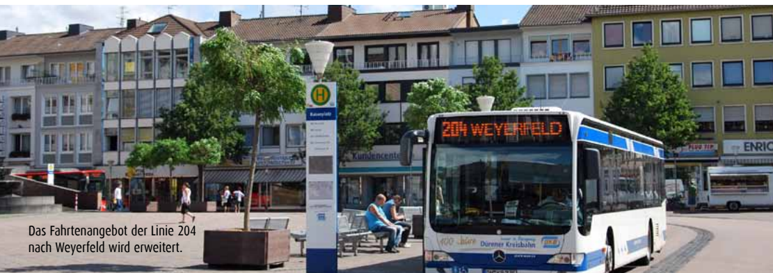
Das Fahrtenangebot der Linie 204 nach Weyerfeld wird erweitert.

Die neuen Mini-Fahrpläne für alle Bahnstrecken im AVV sind bei den Verkehrsunternehmen kostenlos erhältlich.