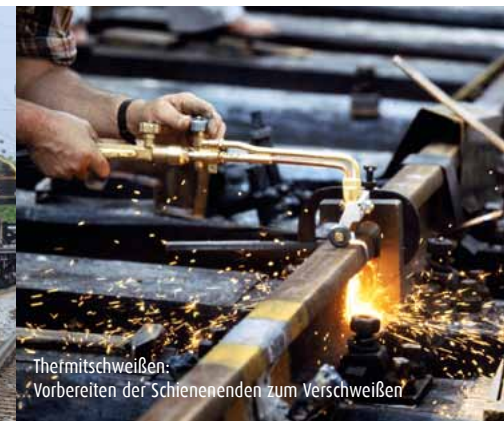
Thermitschweißen: Vorbereiten der Schienenenden zum Verschweißen