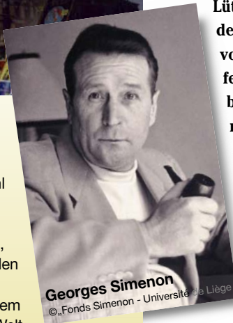
Georges Simonon

Geöffnet täglich von 10 - 18 Uhr (freitags bis 19 Uhr)