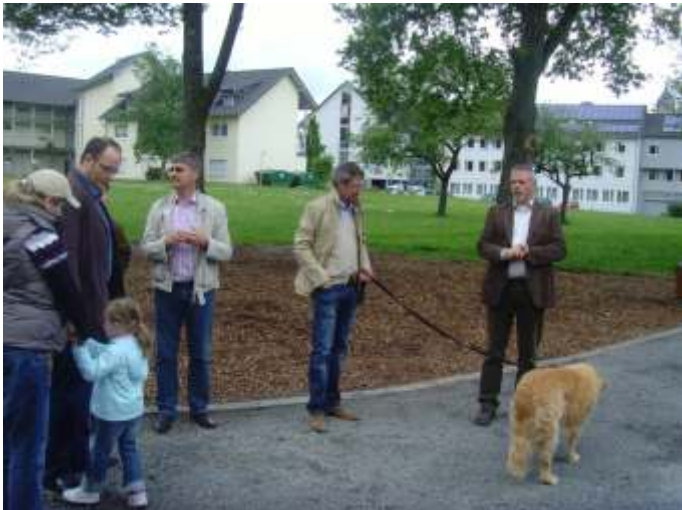
Saisonöffnung im neu gestalteten Freizeitpark hinter dem Rathaus.

Die am Bau Beteiligten hoffen, dass alle Morsbacher ein Auge auf den neuen Park werfen, damit der Vandalismus hier keine Chance hat. W. Schuh