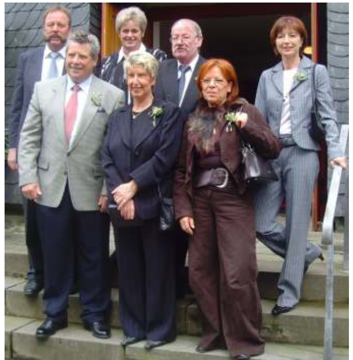
Gruppenbild der Kommunionjubilare von Lichtenberg.

April 1959: Letztmalig vor ihrem Abriss empfingen 12 Kinder in der alten Pfarrkirche St. Josef durch Pfarrer Paul Klose ihre Erste Heilige Kommunion. Nach nunmehr 50 Jahren traf man sich erneut, um gemeinsam mit den Diamant- und Silberkommunikanten dieses Jubiläum mit einer Messe zu feiern. Während sich die Jubilare der Diamantenen Kommunion anschließend im Hotel „Zum Römertal“ zu einem gemeinsamen Mittagessen einfanden, trafen sich die Goldkommunikanten im Restaurant „Rolandsburg“ in Morsbach, um dort in einer gemütlichen Runde bis zum späten Nachmittag alte Geschichten aus der Schulzeit aufzuwärmen. „Ein gelungener Tag“ war die Meinung aller, ein Treffen, das auf jeden Fall wiederholt werden soll.