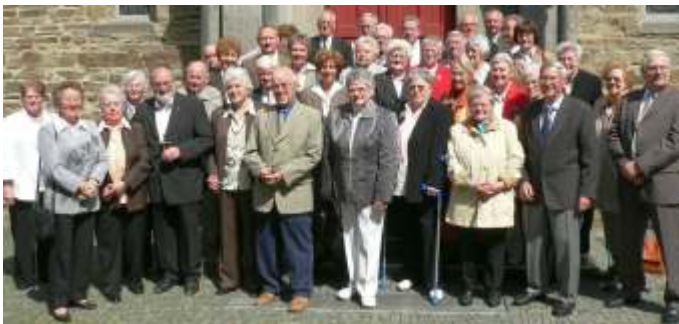
Gruppenfoto vor dem Portal der Basilika: Die Teilnehmer an der Feier der Eisernen Kommunion.