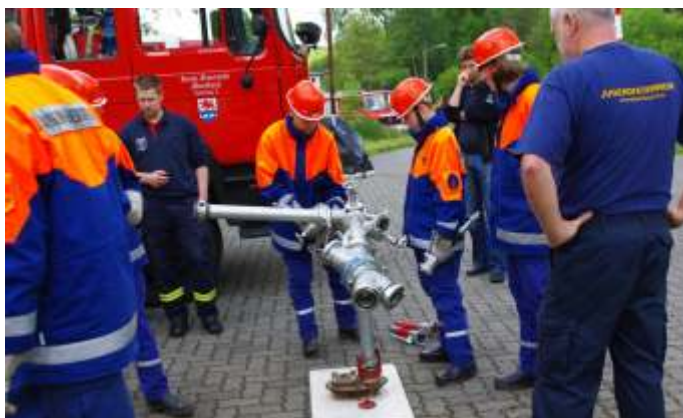
Auch Morsbacher Jugendliche errangen die „Jugendflamme 2“.