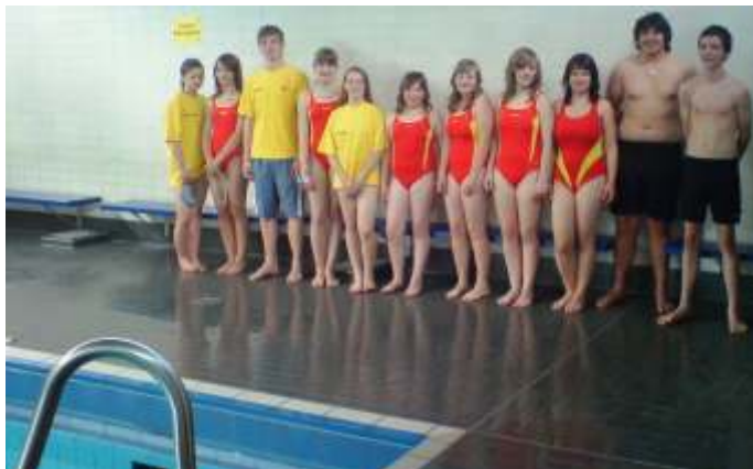
Die neuen Rettungsschwimmer der DLRG-Ortsgruppe Morsbach.

Da der DLRG Ortsgruppe Morsbach aus zeitlichen und gesundheitlichen Gründen zum Ende des Jahres Trainer verlassen werden, wird dringend nach Ersatz gesucht. Wer Lust und Interesse an der Arbeit mit Kindern und Jugendlichen hat, kann sich bei der DLRG OG Morsbach melden. Voraussetzung für diese Arbeit sind der Besitz des deutschen Rettungsschwimmerabzeichens in Silber. Infos gibt es bei Udo Anders 02294/90445.