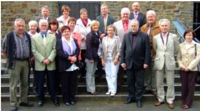
Die Kommunionkinder der Jahrgänge 1958/59 trafen sich kürzlich zur Feier ihrer Goldkommunion in Ellingen wieder.

Beim geselligen Teil der Goldkommunionfeier trafen sich die Jubilare in Morsbach nachmittags zu Kaffee und Kuchen im Bistro „Alt Morsbach“ und zum Abendessen beim „Knoorz“. Gute Erinnerungshilfen waren alte Fotos, die durch die Reihen gingen. Man fand sich oder auch nicht und auf jeden Fall begann die Rekonstruktion der Vergangenheit wie bei einem Puzzle.