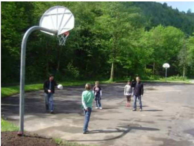
Auch die neue Basketballanlage wurde von den Jugendlichen sofort angenommen.