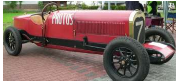
Der älteste Teilnehmer beim Oldtimertreffen in Morsbach war am 17. Mai dieser Siemens Protos Rennwagen aus dem Jahr 1920.