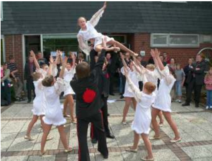
Die Mini-Wolpertinger präsentierten beim „Tag der offenen Tür“ in der Jugendherberge Morsbach ihren Tanz „Engel und Teufel“.

Fazit der überraschten Besucher: Die Herbergen haben sich zu einem modernen Dienstleistungsunternehmen für die reisende Jugend, aber auch jung gebliebene Erwachsene gewandelt und blicken selbstbewusst und mit dem Slogan „100 Jahre sind ein guter Anfang“ in die Zukunft.