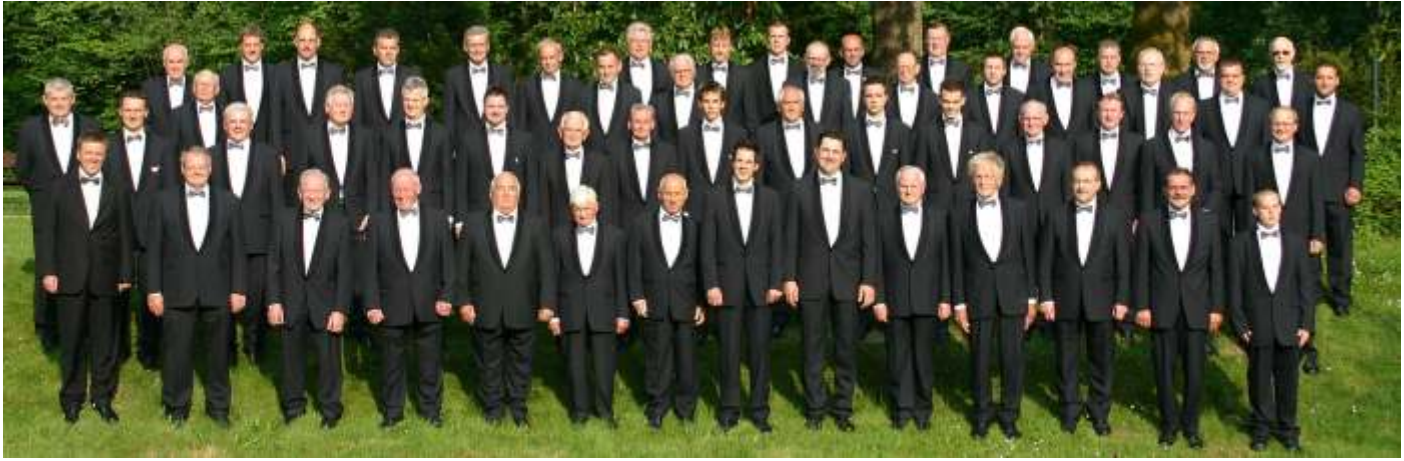
Der MG. „Eintracht“ Morsbach erzielte kürzlich beim Musikwettbewerb in Hessen drei Mal Gold.