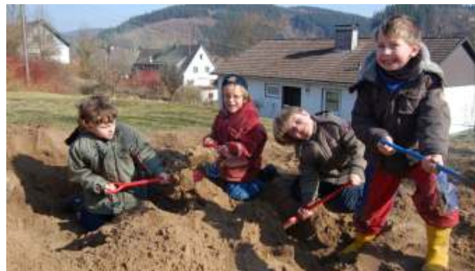
Die Kleinen der Johanniter-Kindertagesstätte Morsbach beim Spielen im Sandkasten.