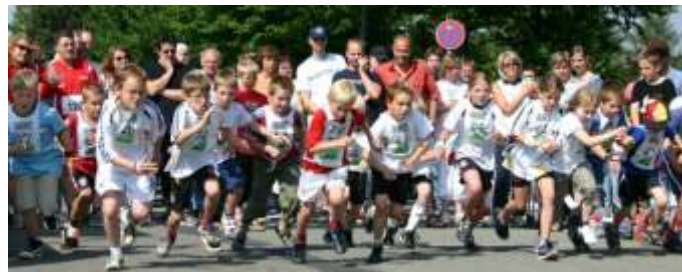
Beim Florianslauf in Lichtenberg sind am 20. Juni sicher wieder viele Sportler am Start.