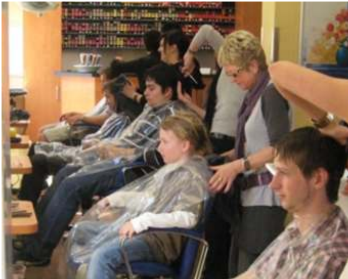
Im Salon Stangier präsentierte der ehemalige Deutsche Meister und Europameister Ralf Nusskern neue Haartrends für Männer.

An den Morsbacher Modellen wurde im Laufe des Nachmittags mit viel Erfolg die verschiedensten Farbneheiten wie Paintings und anderen Highlights getestet. „Naturtonveredelung ist das Stichwort für 2009“, wiederholte Nusskern immer wieder. „Es geht nicht mehr um auffälliges Färben. Kleine Farbhilights reichen für einen modernen Männerhaarschnitt.“