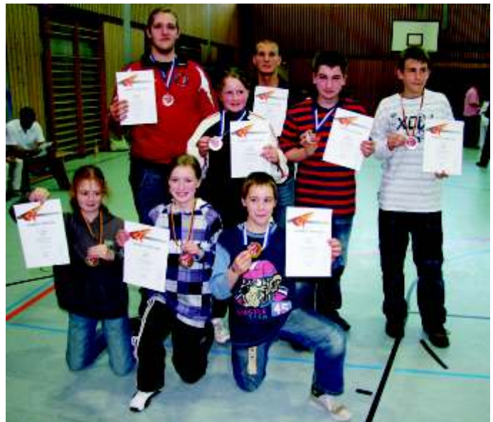
Mit Erfolg nahmen die Morsbacher Taekwondo-Sportler an einem Turnier in Frankfurt teil.

Angestrebt werden in Zukunft die Teilnahme an Ranglistenturnieren sowie deutschen und internationalen Meisterschaften, ein weiter Weg, der aufgrund der talentierten Kinder und Jugendlichen große Aussichten auf Erfolg haben wird.