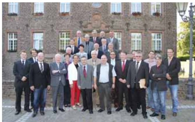
Im Bild der neue Rat der Gemeinde Niederzier.