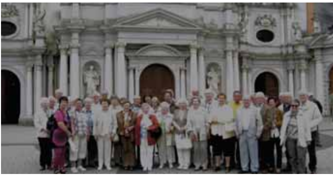
Unser Foto zeigt die teilnehmenden Pilgerinnen und Pilger aus fast allen Pfarrgemeinden unserer Kirchengemeinde auf dem Abteivorplatz.