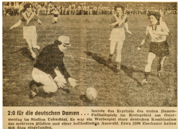
2:0 für die deutschen Damen ... lautete das Ergebnis des ersten Damenmontag im Stadion Uebachtal. Es war ein Werbespiel einer deutschen Kombination aus mehreren Städten und einer holländischen Auswahl. Etwa 3500 Zuschauer hatten sich dazu eingefunden.

Schuleinweihung in Marienberg am 2.5.57. Neufestsetzung Benutzungsgebühren Freibad (50 Pfg. Eintritt), Konzession für die Festhalle erteilt, Bebauung westliche Seite Kapellenstraße, Weiterberatung Haushalt 1957. Vergabe von Arbeiten für die Schule Freiheitsstraße. 8.4.: Bauausschuss: Haushaltsberatungen für 1957, Bereich Bau- und Wohnungswesen, Allein 300.000 DM für Instandsetzung und Neubau. 9.4.: Ratssitzung: Ab dieser Badesaison 50 Pfg. Eintritt im Freibad. Die Beschlüsse der Ausschusssitzungen wurden genehmigt (HuFA, Werksausschuss). 11.4.: Haupt- und Finanzausschuss Beratungen des Haushaltes 1957, Ausbau des Gürzelweges. 16.4.: Ingrid Gorny, Heinz-Josef Schroeder und Christel Schuler aus Übach-Palenberg zur Maschinenschreib-Weltmeisterschaft (von 57 Deutschen) nach Mailand. 16.4.: Paul Völl aus Rheydt stellte in der Carolus-Schwimmhalle den seit 26.4.36 bestehenden 100-m-Kraul-Rekord ein. 21.4.: Philippe Dulong wird Generaldirektor von Carolus-Magnus, Nachfolger von Marcel Montreul, und bleibt es bis 1.12.1961. 22.4.: Erstes Damen-Fußballspiel im Kreisgebiet. 2:0 gewinnt Deutschland gegen Holland im Übachtal. April: Nach Ostern wurden die neuen Fenster (Firma W. Völker aus Lövenich) in der Pfarrkirche St. Theresia Palenberg von der Firma Selbach aus Köln eingebaut.