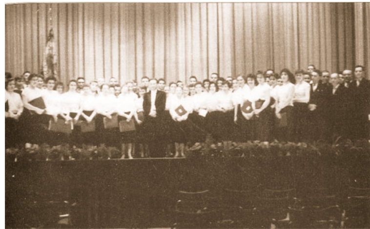
Abb. 14: Der Übacher Kirchenchor während des Konzerts im Rahmen des Cäcilienfestes.

7.11.: Aus dem Gemeinderat: Haupt- und Finanzausschuss: Weiterberatung Beschaffung eines Feuerlöschfahrzeuges, Beihilfe für das Diözesansportfest am 28./29.6.1958 über 1000 DM, Zuschuss für das Hallenbad der Gewerkschaft Carolus-Magnus, Vergabe von Arbeiten am Schulneubau Martin-Luther-Straße. 11.11.: An diesem Tag wieder zahlreiche Martinszüge von Schulen und Kindergärten in Übach-Palenberg. 12.11.: Ratssitzung: Die Beschlüsse der Ausschusssitzungen (HuFA und Schul- und Erziehung) wurden genehmigt. 20.11.: Versammlung des ÜGV 1848 anlässlich des Volkstrauertages im Hotel Heinrichs, anschließend Marsch zum Friedhof mit Totenehrung. 22.11.: Aus dem Gemeinderat: Haupt- und Finanzausschuss: