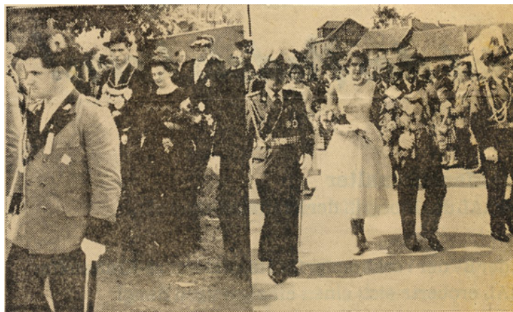
Links das Marienberger, rechts das Uebacher Königspaar im Festzug beim Bürgermeister-Schützenfest am Sonntag in Windhausen.

4.7.: Aus dem Gemeinderat: Schul-, Erziehungs- und Kulturausschuss: Gewährung von Studienbeihilfen, Haushaltsmittel für den sächlichen Bedarf an den Schulen. 4.7.: Haupt- und Finanzausschuss: Gewerbeangelegenheiten, weitere Erschließung der Ernst-Wiechert-Straße, Weiterbildung der Ratsmitglieder. Vergabe von Arbeiten Schulneubau ev. Volksschule Boscheln. 7.7.: Gartenbaufest der Dorf-Vereine in Frelenberg gefeiert. 7.7.: 7000 Besucher im Freibad, erneuter Rekordbesuch im Jahre 1957. 8.7.: Über 200 Rentner und Invaliden in Scherpenseel, Windhausen u. Siepenbusch schlossen sich zu einem Invalidenverein zusammen.