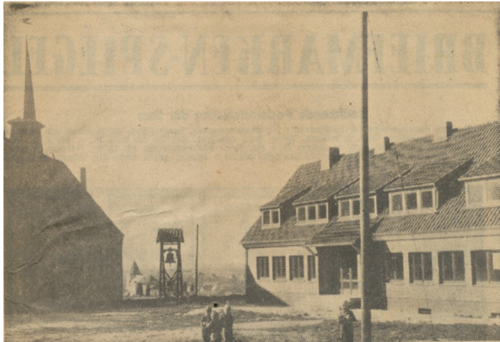
Ein Mittelpunkt evangelischen Gemeindelebens ... werden einmal die beiden Gebäude werden, die man auf diesem Bilde sieht. Sie liegen auf der Höhe, mitten in der Siedlung von Frelenberg. Links sieht man die neue evangelische Christuskirche, zu der auch ein Gemeindefestsaal gehört — Kirche und Saal fassen rund 200 Menschen. Rechts daneben steht der freistehende Glockenstuhl mit der Glocke, in einigem Abstand rechts neben diesem der evangelische Kindergarten. Der Kindergarten ist noch nicht fertig. Es steht noch nicht fest, ob er im Mai oder Juni eingeweiht werden wird.

Volksschule Boscheln. 8.3.: Sozialausschuss: Beihilfen für Kommunionkinder und Konfirmanden beschlossen. 12.3.: Ratssitzung: Die Beschlüsse der Ausschusssitzungen wurden genehmigt (Schul- und Erziehung, HuFA, Sozial). III. Nachtragshaushalt für 1956 beschlossen, Vergnügungssteuerordnung für ÜP. 12.3.: Haupt- und Finanzausschuss: Vergabe von Arbeiten für die Gemeinschaftshalle (Festhalle). 19.3.: Richtfest an der ev. Auferstehungskirche in Marienberg. 20.3.: Theodor Bohnen wurde 80 Jahre. 75. Gründungstag des Kaufhauses Bohnen und Plum. 21.3.: Aus dem Gemeinderat: Haupt- und Finanzausschuss: Planung Schulneubau ev. Schule Boscheln, Beratungen des Haushaltsplanes 1957, Einweihung der Festhalle am 12. 5. 1957. Vergabe von Arbeiten für die Festhalle.