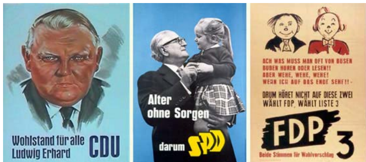
Abb. 11: Auswahl von Wahlkampfplakaten, wie sie im Bundestagswahlkampf des Jahres 1957 verwendet wurden.

1.9.: Schaffung eines neuen Dekanates bei den kath. Christen: Übach-Palenberg-Baesweiler-Oidtweiler-Beggendorf-Setterich. 3.9.: Bundesminister a.D. Waldemar Kraft sprach in Übach-Palenberg bei der CDU (Bundestagswahlkampf). 5.9.: Aus dem Gemeinderat: Haupt- und Finanzausschuss: Erlass ordnungsbehördliche Verordnung (Sicherheit, Ordnung, Sauberkeit), Erlass einer Satzung zur Reinigung von Straßen, Wege und Plätze, der Bahnhof Palenberg soll in "Übach-Palenberg" umbenannt werden., Änderung der Kreis bzw. Gemeindegrenzen, Benennung des Behringweges und Am Sonnenhof, Anlegung eines Kinderspielplatzes in Marienberg, Vergabe von Arbeiten am Schulneubau Martin-Luther-Straße.