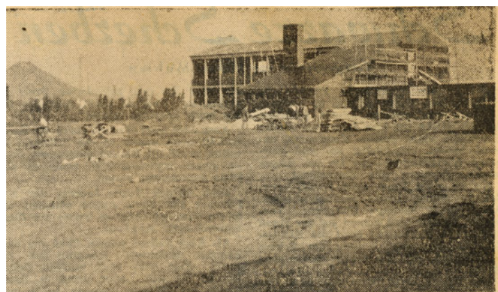
Die neue evangelische Volksschule in Boscheln der erste Bauabschnitt steht im Rohbau. Es ist mit sechs Klassen und Nebenräumen, die voraussichtlich im kommenden Frühjahr in Betrieb genommen werden. Eine Hausmeisterwohnung ist ebenfalls im Bau.

3./4.8.: Fußball-Jugendturnier des VfR Übach-Palenberg auf dem Sportplatz an der Bahn. 5. - 25.8.: Haussammlung zur Finanzierung des Mahnmals an der Karlskapelle in Palenberg. 8.8.: Aus dem Gemeinderat: Haupt- und Finanzausschuss: Erweiterung der Hauptsatzung und der Geschäftsordnung, Gewerbeangelegenheiten, Beihilfeangelegenheiten, Errichtung von Turnhallen, Ausbau Gürzelweg, Beihilfen für die Kindergärten in Marienberg und Frelenberg, Erweiterung Friedhof Brünestraße, Richard Altmann wird stv. Schiedsman, Bezirk III. Der Bahnhof Palenberg soll in "Übach-Palenberg" umbenannt werden, Vergabe von Arbeiten (Schule Martin-Luther-Straße, fünf Straßeninstandsetzungen). 11.8.: VfR-Fußballer auf großer Fahrt nach Österreich und Italien. Mehrere Freundschaftsspiele. 13.8.: Ratssitzung: Kanalisation Ortsteil Scherpenseel. 16.8.: Die kath. Palenberger Pfarrkirche hat Buntglasfenster erhalten.