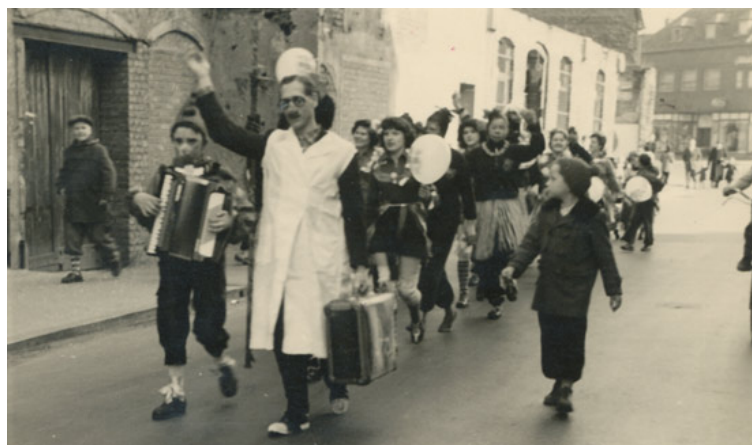
Abb. 2: Straßenkarneval in Übach. Hier eine Fußgruppe der VfR-Handballerinnen.

3.3.: 3. Tulpensonntagszug durch Windhausen und Scherpenseel, organisiert von der KG Scherpe-Bösch-Wenk. 4.3.: Rosenmontag auch in Übach-Palenberg. Kleinere Umzüge in Frelenberg, Boscheln und Palenberg. 5.3.: Traditioneller Fastnachtsball der Trommler- und Pfeiferkorps Einigkeit Boscheln im Saale Jansen.