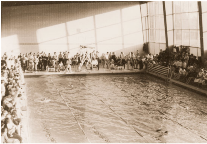
Abb. 15: Die Carolus-Schwimmhalle als Austragungsort des Clubkampfes zwischen Übach-Palenberg und Zagreb. Viele Zuschauer säumten den Beckenrand.