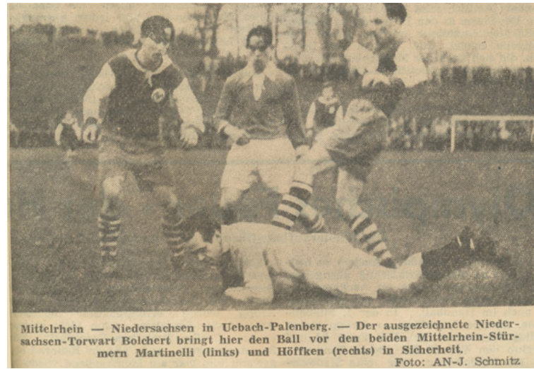
Abb. 13: Pressebild des Spieles des Amateur-Länderpokals im Übachtal, wo der Mittelrhein gegen Niedersachsen mit 3:1 gewann.