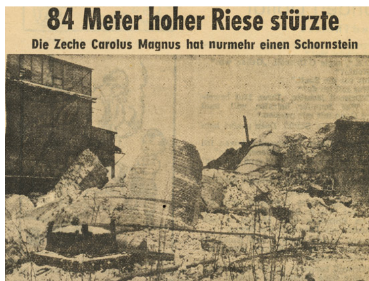
Abb. 1: Große Trümmermengen nach dem Fall des Schornsteines auf dem Zechengelände Carolus-Magnus.

Sitzung der "Kroetsche" aus Palenberg und der "Müüs" aus Übach. 6.2.: 1. Galasitzung der neugegründeten KG Scherpe-Bösch-Wenk unter Präsident Gemünd im Lokal Keuchen. Motto: Viel Wind und keine Segel. 7.2.: Aus dem Gemeinderat: Siedlungs- und Landverpachtungsausschuss: Josef Wynands wurde zum Ausschussvorsitzenden gewählt, Verpachtung einer Ackerparzelle in Übach. 7.2.: Haupt- und Finanzausschuss: Delegierte für den Gemeindetag am 9.2.1957 bestimmt, Errichtung einer Turnhalle im Ortsteil Frelenberg, Verpflichtung des Griechischen Nationalballetts für den 15.9.1957, Vergabe von Arbeiten an der Gemeinschaftshalle (Festhalle). 8.2.: Ratssitzung: Die Beschlüsse der Ausschusssitzungen wurden genehmigt. Erlass der Nachtragshaushaltssatzung für 1954. 9.2.: Kirchenchor Palenberg hielt Jahreshauptversammlung. Arnold Sieben wurde neuer 1. Vorsitzender. 13.2.: Bunter karnevalistischer Abend der KJG Boscheln im Saal Dohmen.