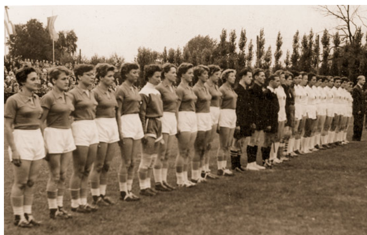
Abb. 8: Damen-Handball-Länderspiel in Übach-Palenberg. Die deutsche Feldhandball-Nationalmannschaft schlug die Niederlande in einem spannenden Spiel im Übachtal mit 5:3 Toren.

4.8.: Haupt- und Finanzausschuss: Gewerbeangelegenheiten, Grundstücksangelegenheiten, Beihilfeanträge. 9.8.: Ratssitzung: Straßenausbau beschlossen, u.a. Thorn- und Freiheitsstraße bekommen neue Decken. Beratungen der Bauausschuss- und HuFA-Verhandlungen vom 21.7. und 4.8. 9.8.: Haupt- und Finanzausschuss: Vergabe von Straßenbauarbeiten (Freiheitsstraße und Heckstraße).