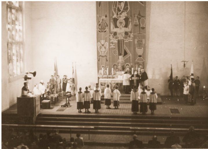
Abb. 4: Blick in die Messe, die anlässlich der Einsegnung der neuen kath. Übacher Pfarrkirche gehalten wurde.