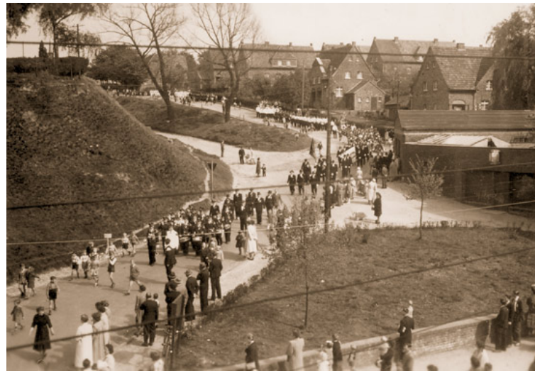
Abb. 3: Großes Festaufgebot beim Stiftungsfest 25 Jahre TPK "Rheinklänge" Frelenberg. Hier der Festzug im Gürzelweg.

1.5.: Maifest der Maijungen (Siedlung) in Boscheln, u.a. mit Festzug mit dem Maikönig und Volkstanz und Maibaumaufsetzen auf dem Lindenplatz. Anschließend Maifest im Festlokal Dohmen. 1.5.: Ein Wolkenbruch sorgte in