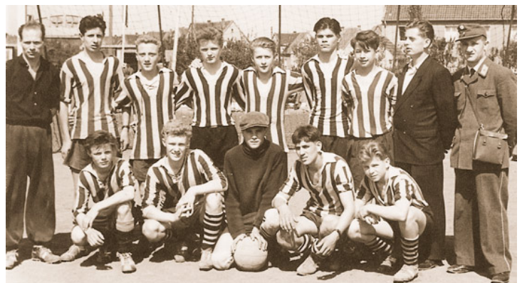
Abb. 6: Die erfolgreiche A-Jugend des VfL Übach-Boscheln. Sie wurde 1955 Kreismeister.