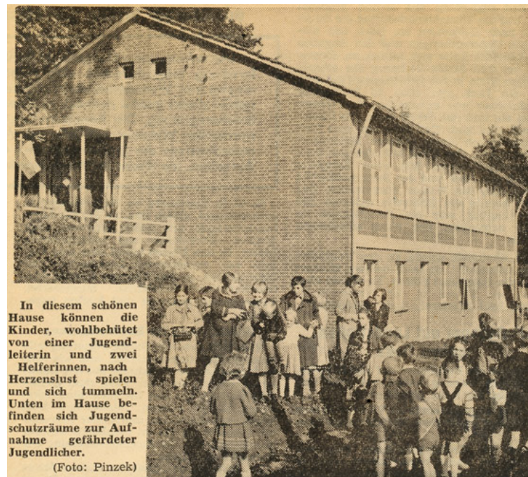
Abb. 11: Einweihung des neuen kath. Kindergartens in Marienberg.