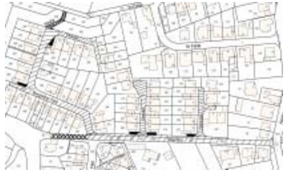
(Flurkarte des Kreises Aachen. Dieser Plan ist urheberrechtlich geschützt.)

Gemäß § 6 des Straßen- und Wegegesetzes des Landes Nordrhein-Westfalen (StrWG NRW) vom 23.09.1995 (GV. NRW. S. 1028, 1996 S. 81, 141, 216, 355) in der derzeit gültigen Fassung werden die vorgenannten Erschließungsanlagen dem öffentlichen Verkehr als Gemeindestraßen (///) gewidmet. Für das ca. 40 m lange Teilstück des Flurstücks 292 sowie für das Flurstück 436 wird die Widmung auf den Fuß- und Radverkehr (xxx) beschränkt, für die Flurstücke 428, 415, 414, 370 und 489 auf die Nutzung als Stellfläche für Müllgefäße (■).