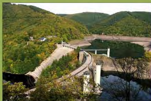
Die Urftstauammer im Herzen des Nationalpark Eifel