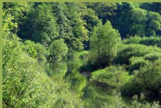
Unberührte Natur im Nationalpark Eifel