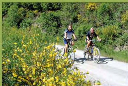
Die K7 führt Radfahrer und Wanderer durch unberührte Natur inmitten des Nationalparks Eifel