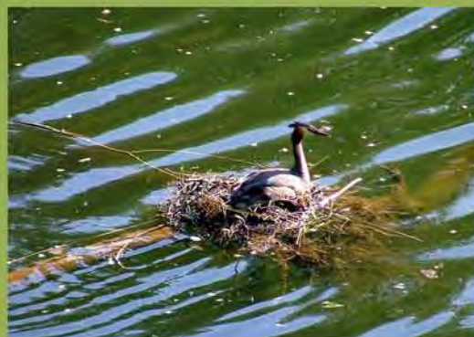
Brütender Haubentaucher im Nationalpark Eifel