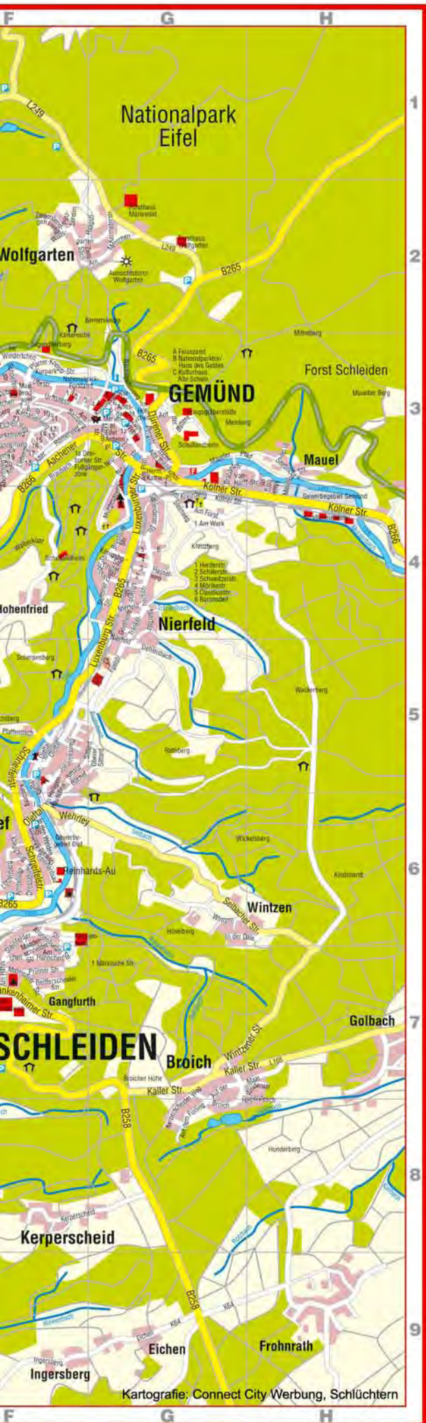
Kartenausschnitt Kneippkurort Gemünd