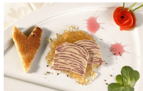
Lucullus, eine Vorspeisenspezialität aus Valenciennes

belgisch-französischen Grenze die Stadt Valenciennes im Departement Nord nach nur 250 Kilometer Fahrt.