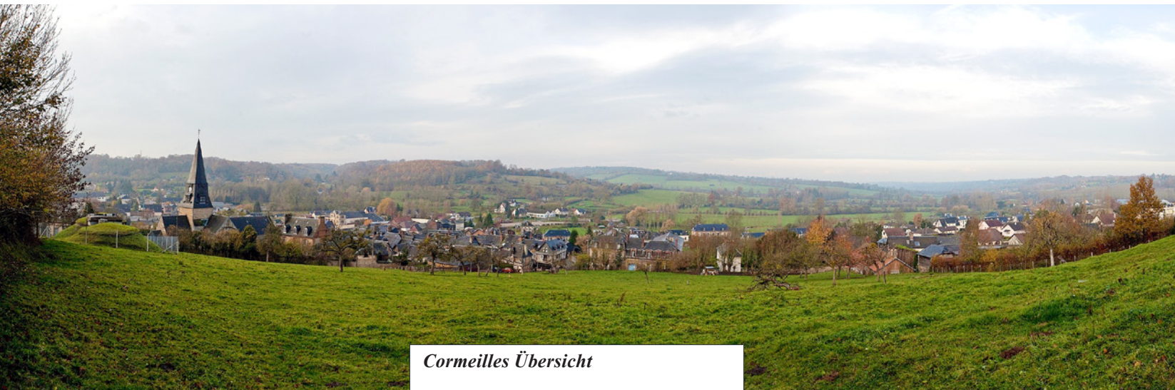
Panorama der Stadt Cormeilles