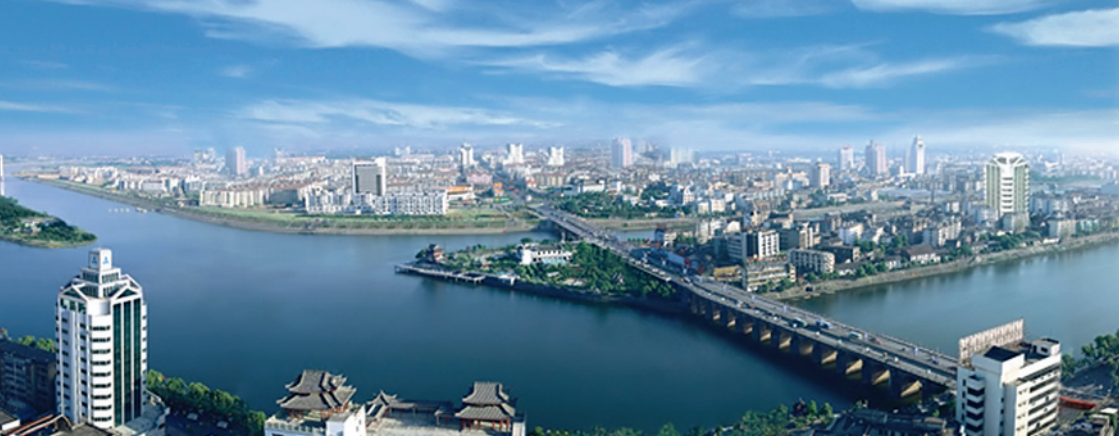
Skyline von Jinhua