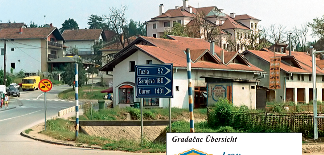
Kilometerhinweis nach Düren