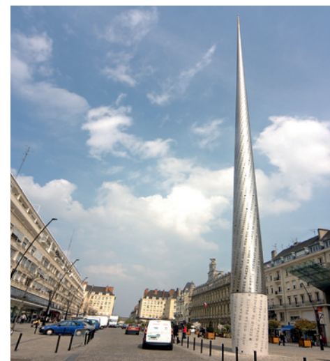
„Le Beffroi“ — „Der Wachturm“ Das neue Wahrzeichen Valenciennes im Zentrum der Stadt.

Valenciennes – für Dürenerinnen und Dürener immer eine kleine Reise wert.