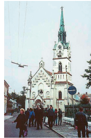
Kath. Kirche im Zentrum