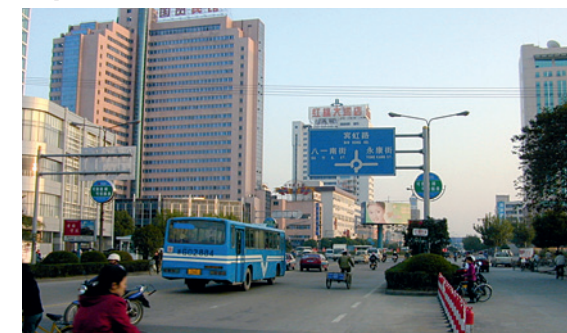
Hauptverkehrsachse von Jinhua

Seit seiner Gründung im März 2008 unterstützt der Partnerschaftsverein Düren-Jinhua e.V. mit verschiedenen Aktionen und Maßnahmen die Städtepartnerschaft zwischen den beiden Städten.