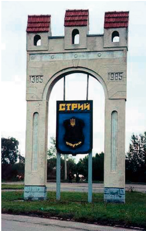
Stadtappen am Ortseingang