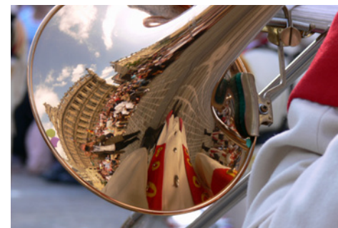
Das Rathaus von Valenciennes aus einem besonderen Blickwinkel beim traditionellen Musikumzug in Valenciennes am ersten Septemberwochenende.