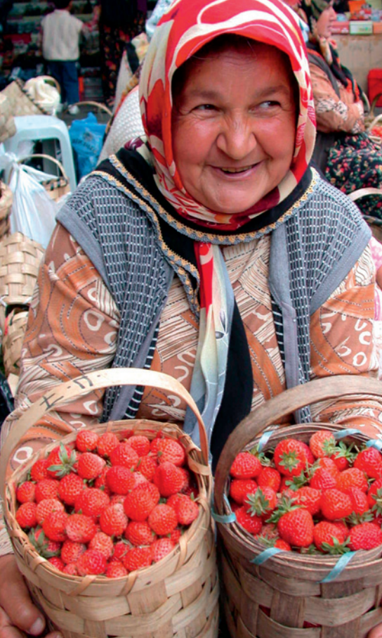
Karadeniz Ereğli ist berühmt für die osmanischen Erdbeeren