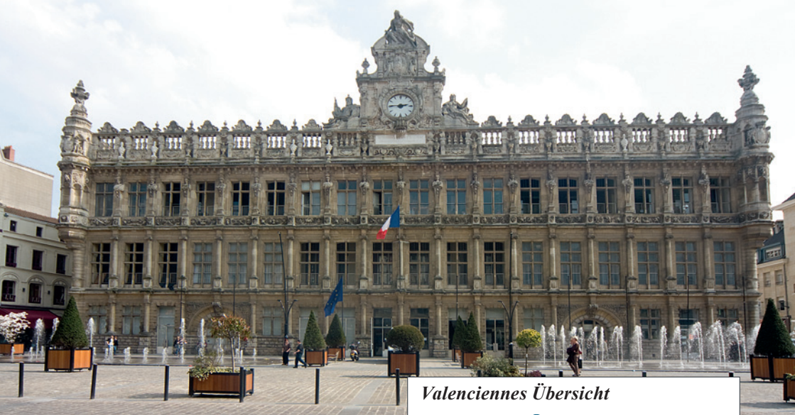
Das Rathaus der Stadt Valenciennes