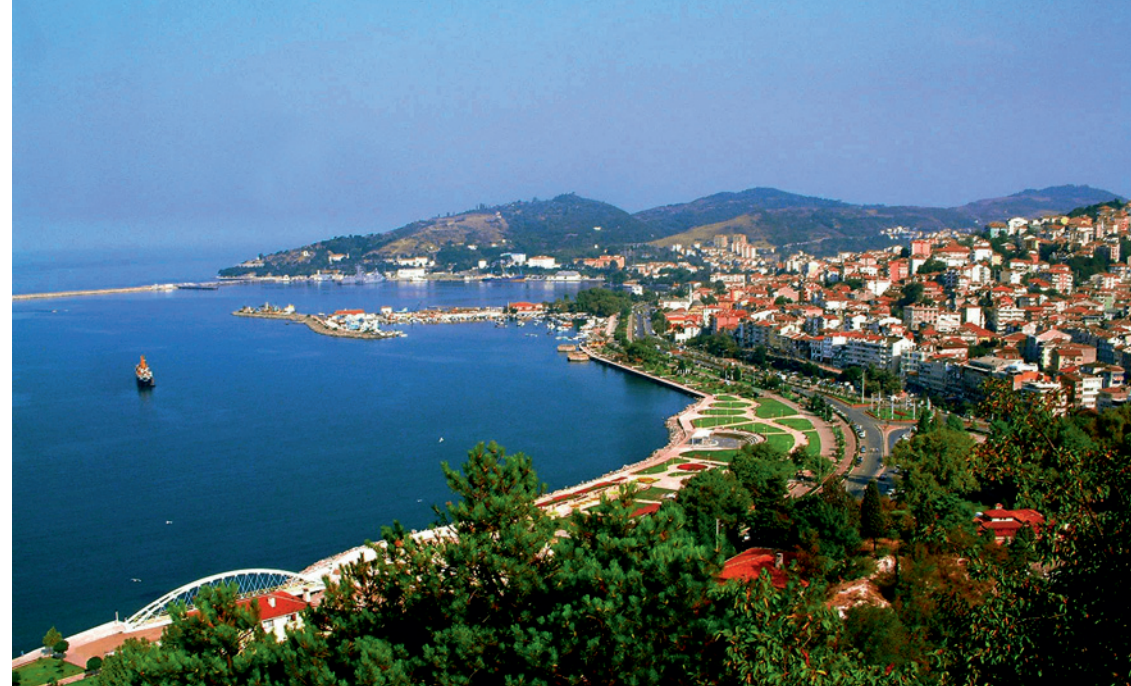
Blick auf Karadeniz Ereğli

Kultur- und Gesangsfestival, statt. Die größte Eisen- und Stahlfabrik (Erdemir) in der Türkei und die große, international bekannte Schiffsfabrik des Landes fügen sich gut in die Landschaft ein und geben vielen Menschen, auch aus dem Umland, ihr Auskommen.