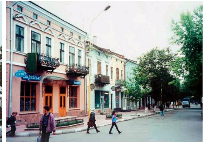
Häuserzeile am Marktplatz