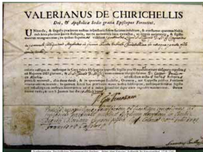
Akten über Kreuzau: Authentik für Kreuzpartikel, 1716-1742.

Im Bischöflichen Diözesanarchiv in Aachen befindet sich eine Urkunde über die Authentizität für Kreuzpartikel, die der Pfarrei Kreuzau zugeordnet ist.