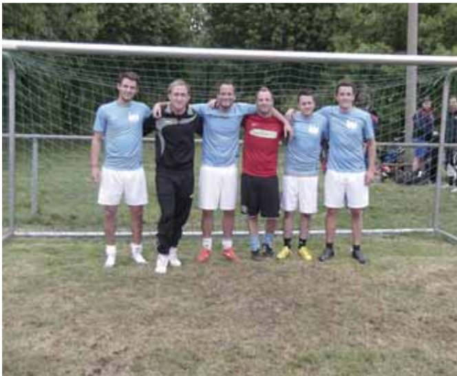
Sieger beim Fußballkleinfeldturnier der Sportfreunde Üdingen 1912: Chicago Players.

Nachdem es im Vorfeld der Veranstaltung häufig regnete, konnte man sich bei der Veranstaltung „Unser Dorf treibt Sport“ der Sportfreunde Üdingen, dass an Fronleichnam, dem 30.05.2013 durchgeführt wurde, über trockenes Wetter freuen. Somit wurde die Veranstaltung am Sportplatz Üdingen wieder ein voller Erfolg. Neben einer Hüpfburg und Spiele für Kinder, sowie mehreren Stände, die dem leiblichen Wohl der Besucher diente, gab es wieder ein Kleinfeld-Fußballturnier als zentrales Event. Hieran nahmen in diesem Jahr 14 Mannschaften (auch wieder mit Beteiligung von Damen) aus dem Ort und der näheren Umgebung teil. Gespielt wurde in 2 Gruppen zu je 5 und einer Gruppe mit 4 Mannschaften mit jeweils 1 Torwart und 5 Feldspielern. Nach dem Achtelfinale in dem die jeweils 3 Besten aus den 5er Gruppen und die beiden ersten aus der 4er Gruppe aufeinander trafen, spielten als Ergebnis aus diesen 4 Parteien, im Halbfinale die Chicago Players gegen Borussia Promille 2 : 0 und die Mannschaft „Ralles 11“ gegen „Eintracht Eule“ 4 : 3. Dritter des Turniers wurde schließlich Eintracht Eule, dass Borussia Promille im kleinen Finale mit 2 : 1 besiegte. Turniersieger wurden die Chicago Players durch ein 2 : 1 über Ralles 11. Ein besonderer Dank gilt wieder den fleißigen ehrenamtlichen Helfern und natürlich den 4 Schiedsrichtern Wolfgang Plum, Markus Thissen, Timo Fassbender und Benny Franke.