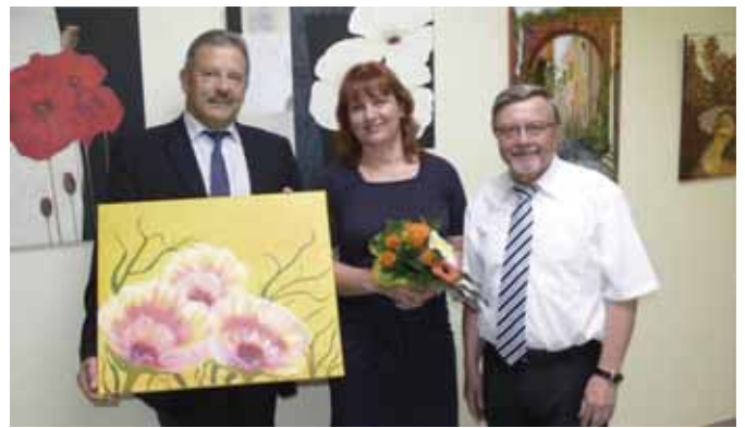
Ausstellungseröffnung am 1. Juli 2013.

Die Ausstellung vom 01. Juli bis zum 30. August 2013 im Kreuzauer Rathaus ist meine erste Kunstausstellung.