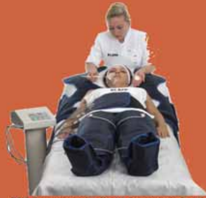
ERIC Pressotherapie, Health Cosmetics GmbH

Einer für alles - und 3 Körperbehandlungen in einem: Arme, Bauch und/ oder Beine