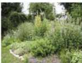
Beet mit Zierpflanzen