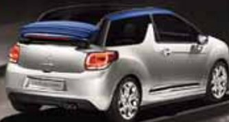
CITROËN DS3 CABRIO Ab € 179,- MTL. RATE