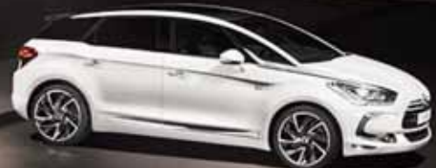
CITROËN DS5 Ab € 289,- MTL. RATE

Günstige Finanzierung auch ohne Anzahlung möglich