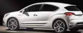
CITROËN DS4 Ab € 219,- MTL. RATE

Exklusives Design und gestalterische Raffinesse, gepaart mit innovativer Technologie – das ist die CITROËN Linie DS. Elegant und visionär zugleich, setzt die Linie DS hohe Maßstäbe in puncto Verarbeitungsqualität. Auch deshalb gewähren wir für alle CITROËN DS Modelle das CITROËN Qualitätsversprechen!