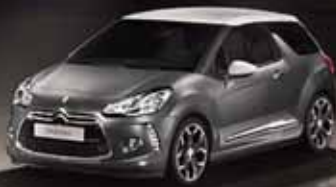
CITROËN DS3 Ab € 149,- MTL. RATE