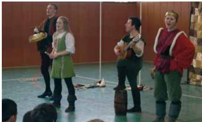
Für ihre schülernahe Darbietung erhielt das Ensemble des White Horse Theatre großen Applaus.

Nach wenigen Augenblicken war das Publikum gefangen in dem mit Leidenschaft und Enthusiasmus vorgetragenen Stück. Gekonnt schlüpfen die vier Akteure in die verschiedenen Rollen der „Maid Marian“. Auch das Publikum bezogen sie mehrmals ein. Als nun also der Bishop und später die Merry Men von Schülerinnen und Schülern dargestellt wurden, war dies ein absolutes Highlight für das Publikum. Nach frenetischem Applaus stürmten große Teile des begeisterten Publikums zur Bühne und versuchten Autogramme der Akteure zu erhalten. „Die haben echt super gespielt!“, lauteten viele der durchweg positiven Schülerrückmeldungen nach dem Stück. Englischlehrer und Organisator Philipp Lobe zog nach seiner ersten White Horse Theater-Veranstaltung ein überaus positives Resümee: „Die Schauspieler haben unsere Schüler begeistert.“