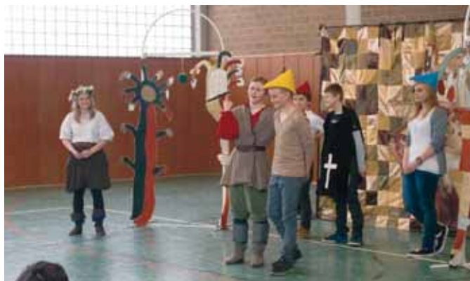
Auch SchülerInnen aus Merzenich wurden in das Stück des White Horse Theaters einbezogen.

Mit interaktivem englischsprachigen Theatergenuss gastierte das „White Horse Theatre“ an der Gesamtschule Niederzier/Merzenich. Die vierköpfige Truppe englischer Muttersprachler reist mit einem großen Repertoire durch ganz Deutschland. Bereits vor 10 Jahren war das „WHT“ erstmals an der Gesamtschule Niederzier/Merzenich und tatsächlich wurde auch damals das Stück „Maid Marian“ aufgeführt. Die Merzenicher Schülerinnen und Schüler der Stufe 7 bearbeiteten das Stück, eine Adaption von Robin Hood, die Robins Freundin Marian ins Zentrum des Geschehen rückt, bereits im Unterricht.